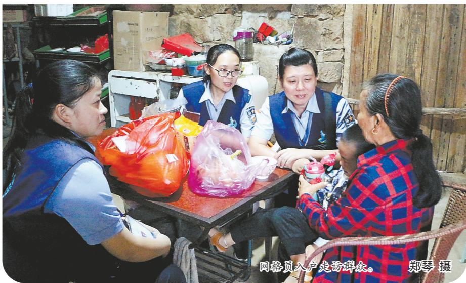
网格员入户走访群众。