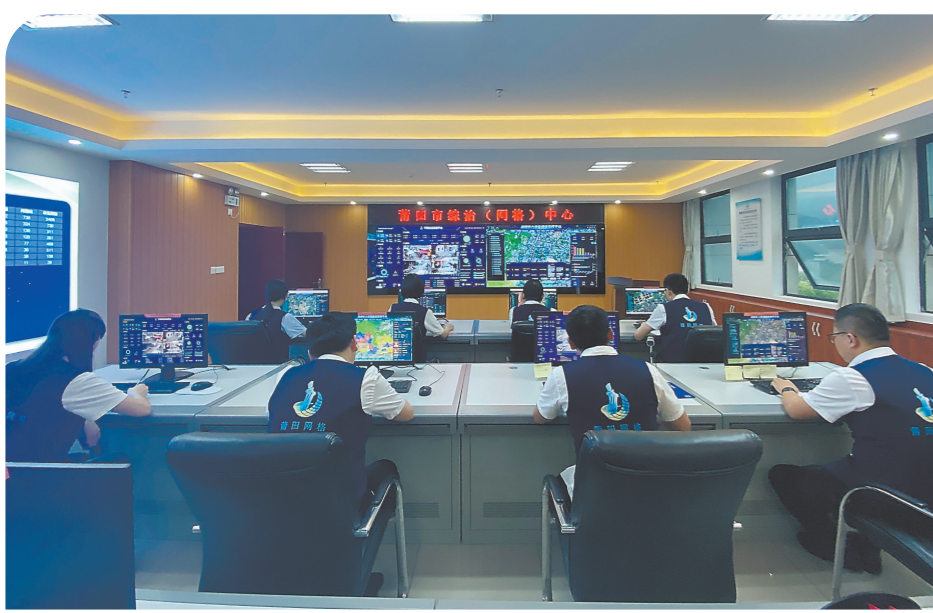
莆田市综治(网格)中心指挥室