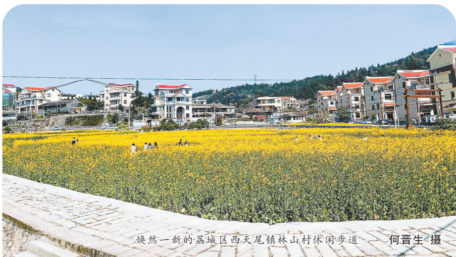
焕然一新的荔城区西天尾镇林山村休闲步道

2023年,通过主题教育检视整改工作,莆田市为推动对破环营商环境问题整改整治,设置“企业家接待日”,把每月第一天作为相对固定的接待日,采取线上视频连线、线下现场接待、民营企业座谈会等方式,广泛收集市场主体对涉企政策、服务等