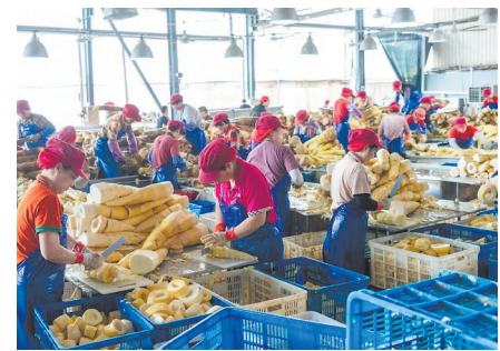
在漳州明成食品有限公司,工人对收购来的鲜笋进行初步加工处理。