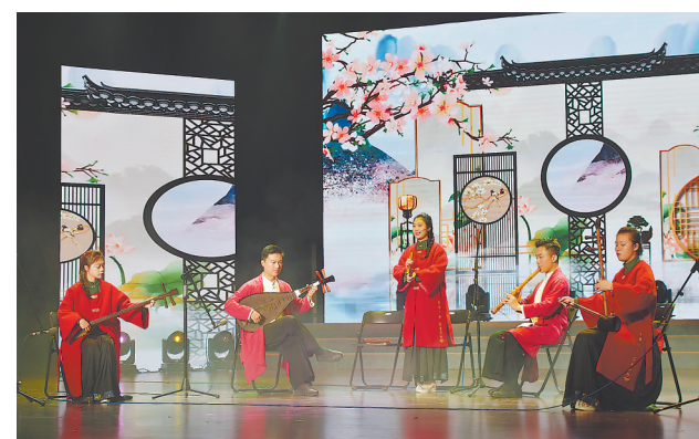
19日晚,福建农林大学2024年新春音乐会在学校大礼堂举办。音画诗朗诵、南音、太极拳等节目轮番上演,广大师生在热闹的氛围中传递新春祝福,感受中华文化魅力。

大家认为,仙游被誉为海滨邹鲁、文献名邦,具有钟灵毓秀的文化地理、崇文重教的文化基因,灿若星河的文化人物、华光异彩的文化艺术、慎终追远的文化习俗,梳理提炼“仙游文脉”对坚守好中华优秀传统文化这个根脉具有典型意义和现实意义。大家表示,将发挥自身优势,助力做好仙游文化的传承、研究、推广、转化,找准大众关注的兴趣点,融合学术、文艺、媒体等各界力量,打造广受欢迎的文化品牌,以文化力量赋能乡村振兴,为同心建设中华民族现代文明作出积极贡献。