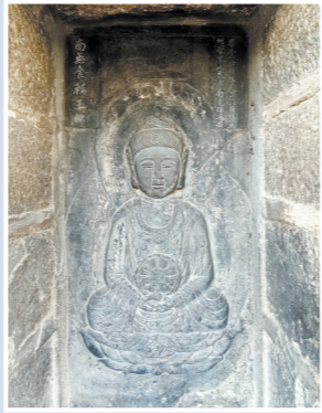
乌塔一层金轮王佛像及题刻其二

乌塔,全名为“崇妙保圣坚牢塔”,闽永隆三年(941年)重建于唐代无垢净光塔的原址,系闽王王延羲为自身、眷属及臣民祈福而建。