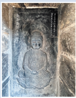
乌塔一层金轮王佛像及题刻其一