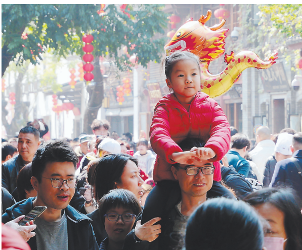
春节期间,三坊七巷历史文化街区引来众多游客。