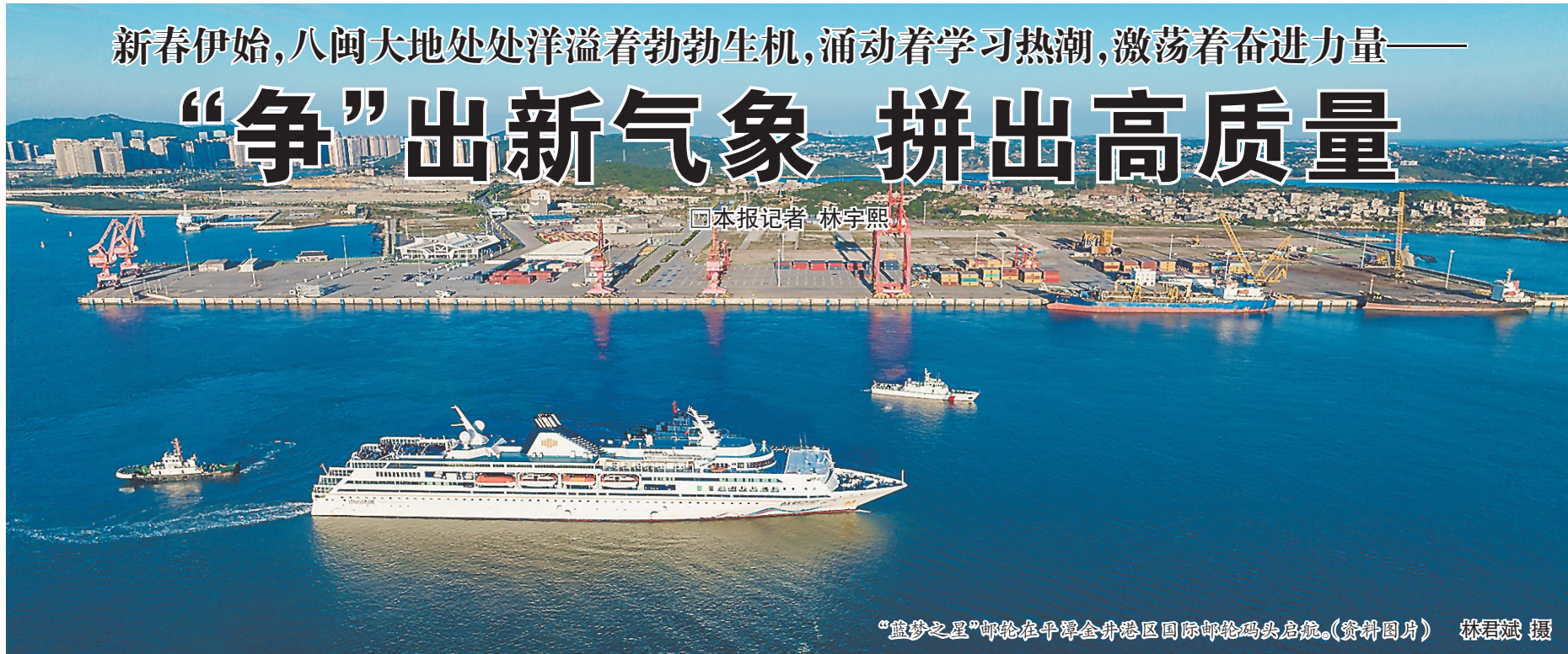
“蓝梦之星”邮轮在平潭金井港区国际邮轮码头启航。(资料图片) 林君斌 摄