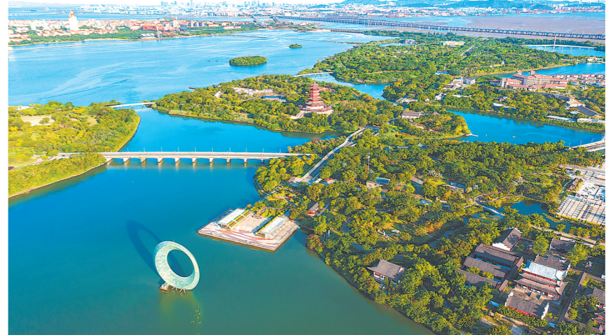
厦门园博苑,厦门的生态名片之一,为厦门“跨岛发展”的先行者和排头兵——集美新城的崛起,奠定了基础。