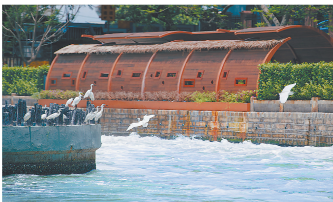
筓筓湖西堤坝口,一群白鹭聚集于此,伺机捕食随潮水涌入的海鱼。