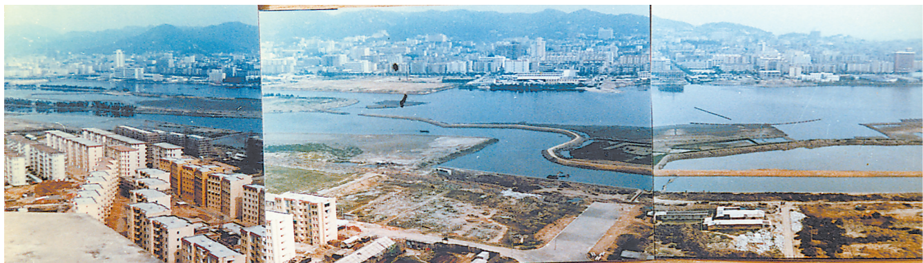
1990年筓筓湖全貌。治理前的筓筓湖,垃圾成堆、污水溢流、鱼虾绝迹。(资料图片)