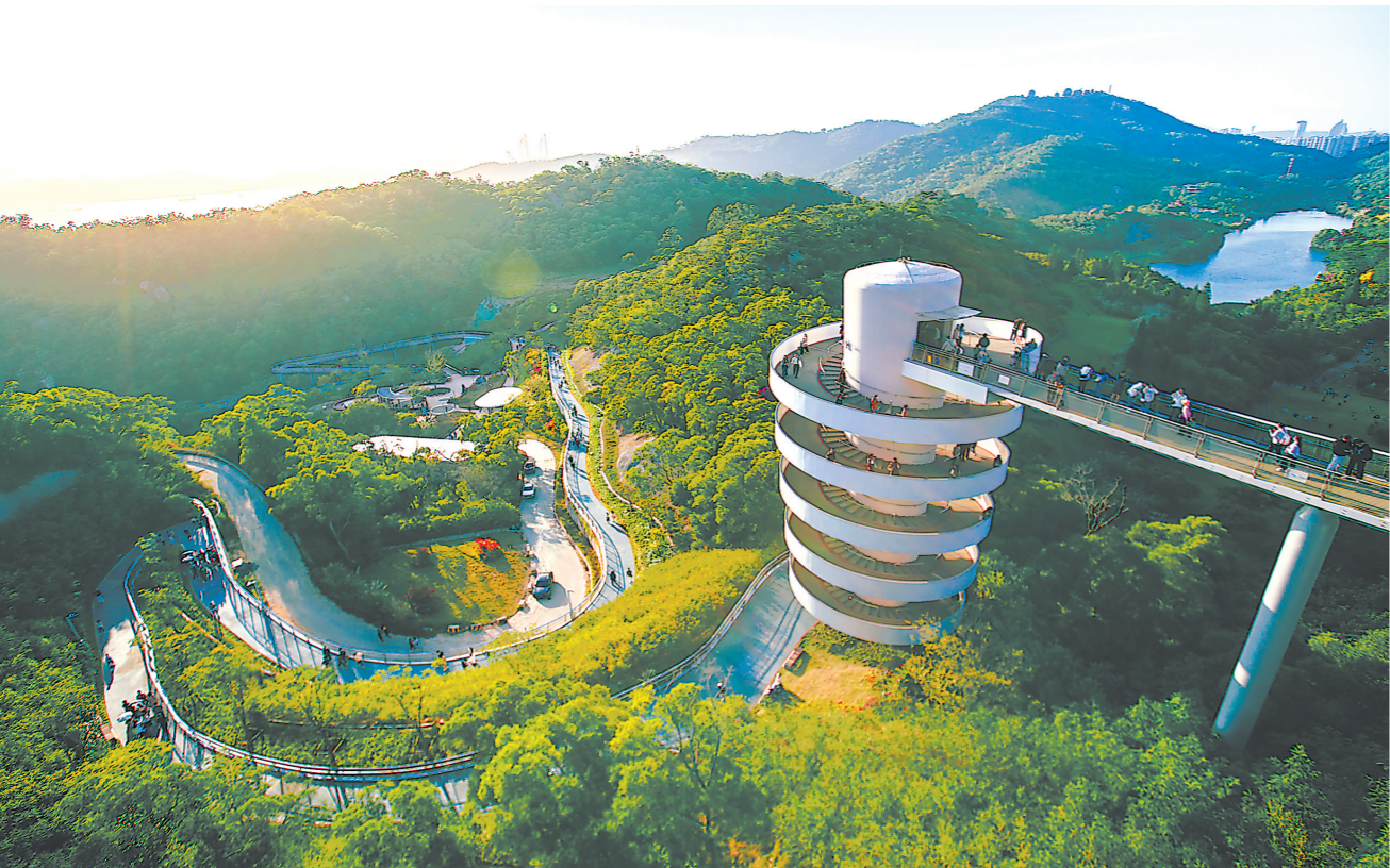
经过6年多建设,全长200多公里的厦门山海健康步道初具规模,为市民游客串联起一条登山看海的路线。