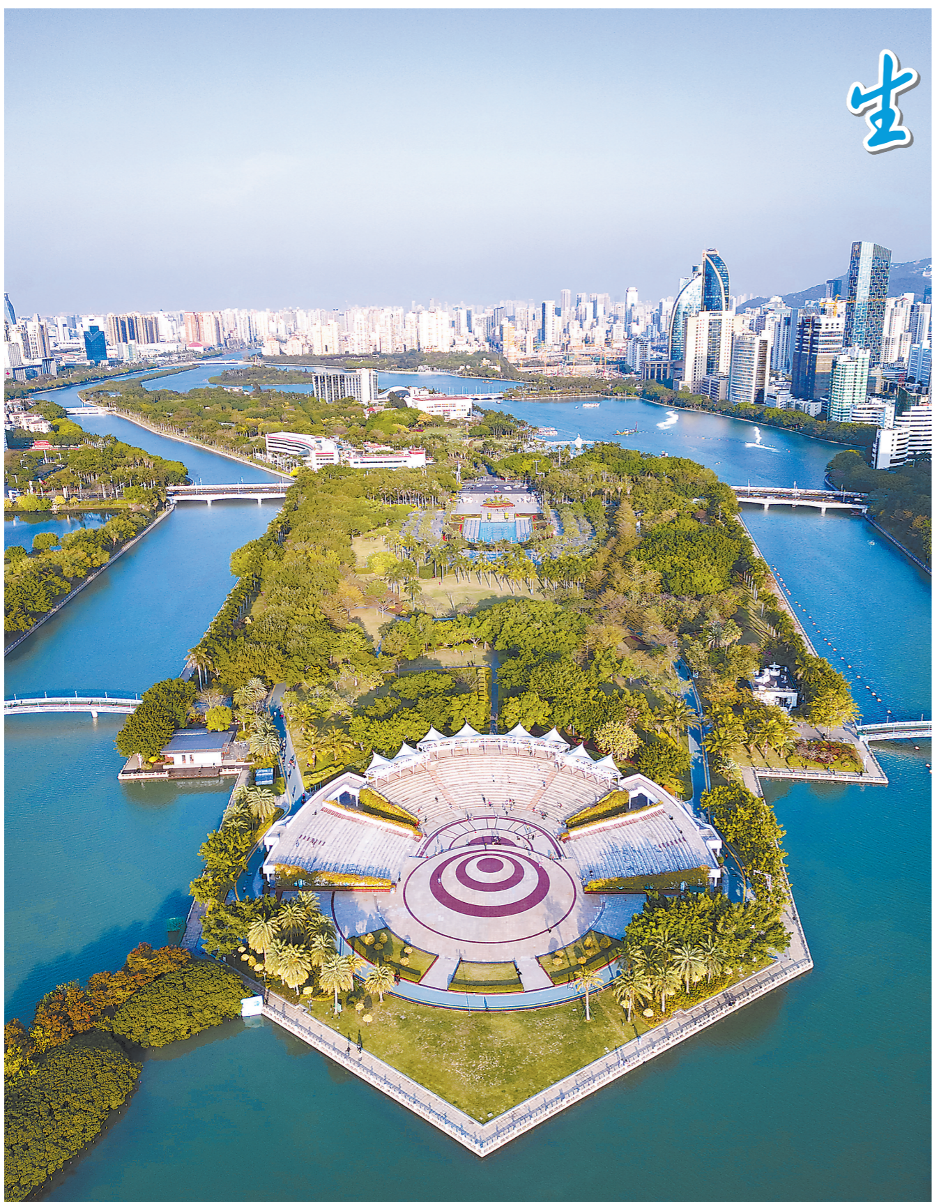
今天的厦门是一座高颜值的生态花园之城。从曾经的臭水湖蝶变为今日的“城市会客厅”,筓筓湖一湾碧水,见证了36年来的久久为功。