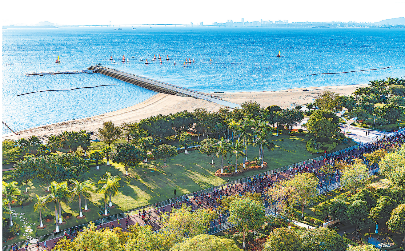
厦门环东海域的滨海旅游浪漫线上,金色沙滩、翠绿椰林与七彩跑道相映生辉,吸引全国各地的跑友前来“打卡”这条美丽的马拉松海滨赛道。