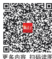
更多内容 扫码读图

厦门,这座改革开放的前沿城市,在生态文明建设的道路上坚持系统观念、久久为功,走出了一条属于自己的路,用实际行动诠释了什么叫作“绿水青山就是金山银山”。