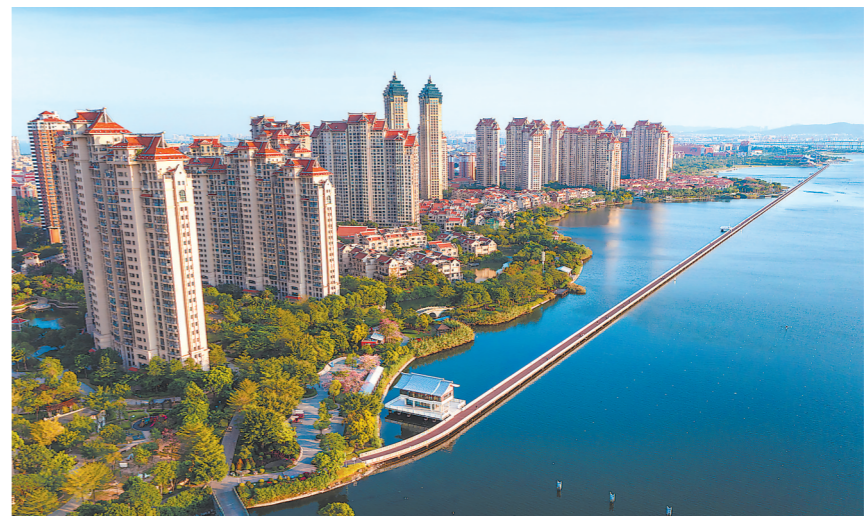
全长2.6公里的海上自行车道横跨杏林湾,从高空俯瞰,宛如一条镶嵌在碧波中的红色飘带。