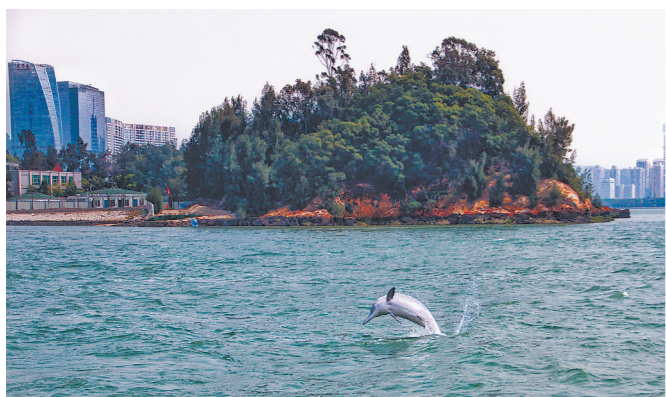
中华白海豚在火烧屿海域畅游。