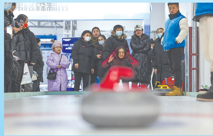
2023年12月16日,市民在首届呼伦贝尔·海拉尔冰雪产品冬季展销会上体验冰壶。