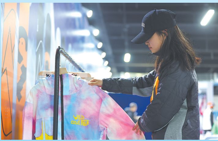
2023年12月16日,顾客在首届呼伦贝尔·海拉尔冰雪产品冬季展销会上挑选雪服。