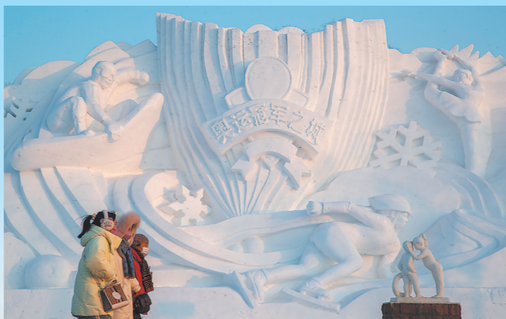
2月7日,几名游客在哈尔滨太阳岛雪博会园区内从雪雕前走过。