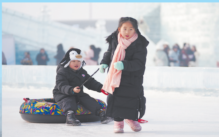
2月10日,游客在哈尔滨冰雪大世界园区内玩雪圈。