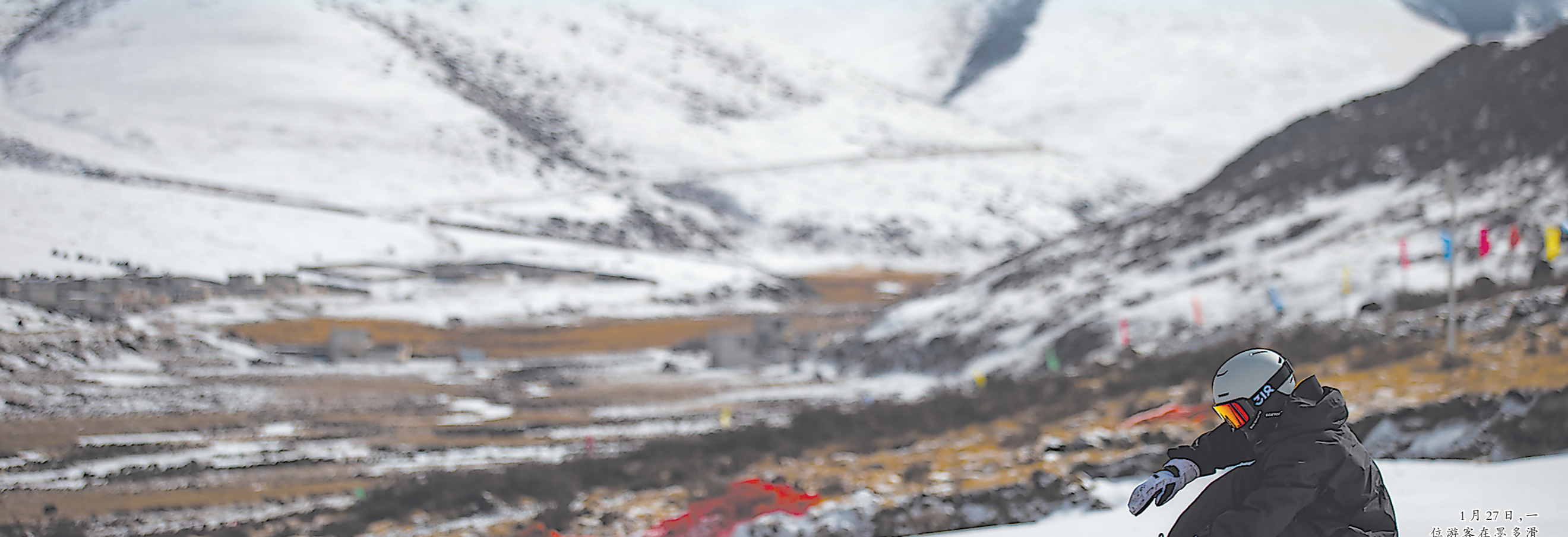
1月27日,一位游客在墨多滑雪场体验滑雪。