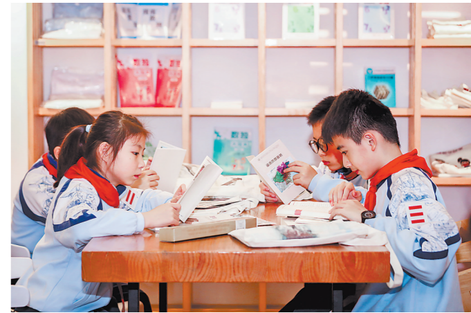
参加活动的孩子们在阅读。

本报讯(记者 吴洪 文/图)近日,由海峡出版发行集团指导、福建新华发行集团主办的第三届“书香两岸迎新春”系列活动在福州举办,并在台北和马祖等地同期举行,为两岸同胞送上文化大餐。