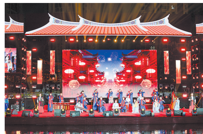
23日,“龙腾盛世 福海同文”漳州市龙文区2024年元宵晚会在闽南水乡举行,吸引了许多观众观看。锦歌、大鼓凉伞等漳州非遗文化节目精彩上演。图为两岸艺术家在演奏传统民乐《金蛇狂舞》。

该基地投用后,宁化街道还将吸引榕台商家入驻商务区,开设榕台美食街,打造与榕台企业相关的上下游产业链,助力榕台企业更好发展。