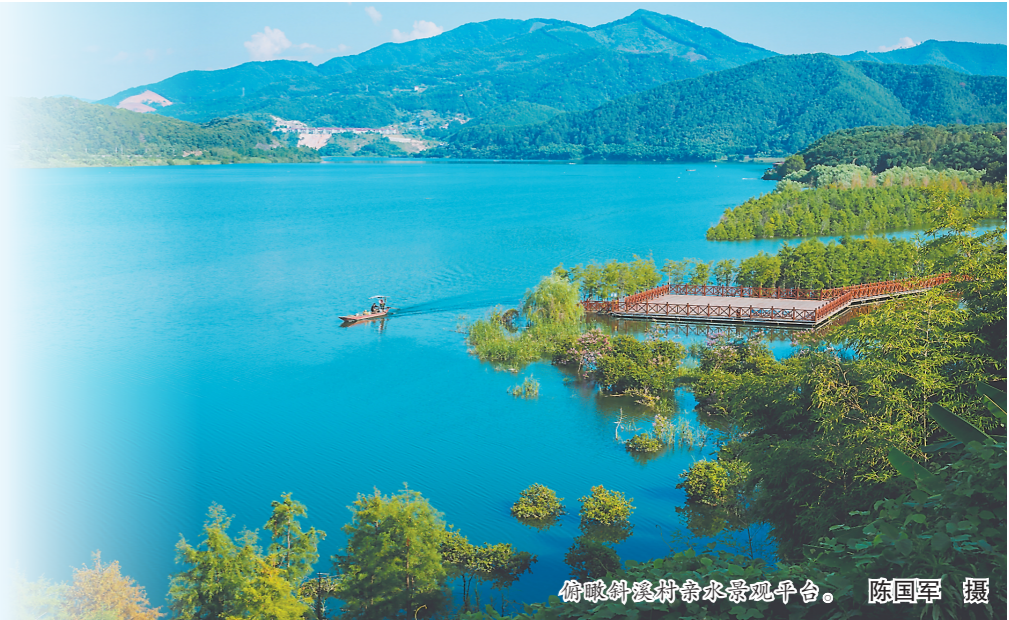
俯瞰斜溪村亲水景观平台。

酒香也怕巷子深,如何打响其知名度?譬如,影视作品的宣传带动就不容小觑:电影《云水谣》让更多人向南靖土楼充满了向往,电影《后会无期》使东极岛一度成为游客们的打卡胜地,近期热播的电视剧《繁花》让上海的黄河路成为众多粉丝和游客争相打卡的热门地点……今后,可吸引优秀的影视制作班底,前来闽江流域的城市或景区拍摄,通过影视作品的传播展现闽江流域的文化元素和讲好闽江流域的故事,打响闽江文旅知名度。