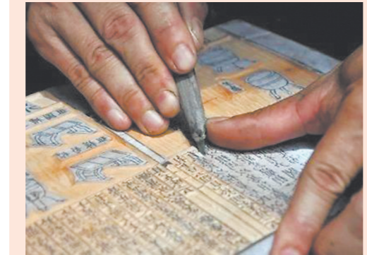
建本雕刻 (资料图片)