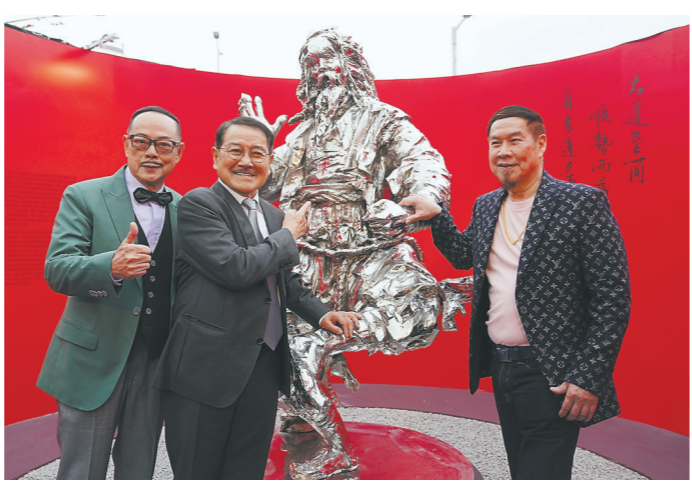
3月15日,在香港中环,曾经饰演过金庸武侠小说人物的香港演员在雕塑前留影。