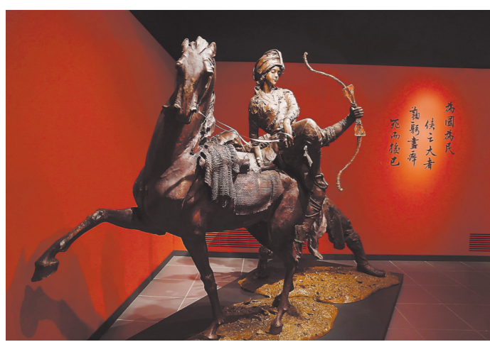
这是3月12日在香港文化博物馆拍摄的由雕塑家任哲创作的金庸武侠小说人物雕塑。

“我希望来自世界各地的‘金庸迷’经过雕塑时能一眼认出郭大侠,然后摆出和他一样炫酷的造型,合影留念。”任哲说。(新华社香港3月17日电)