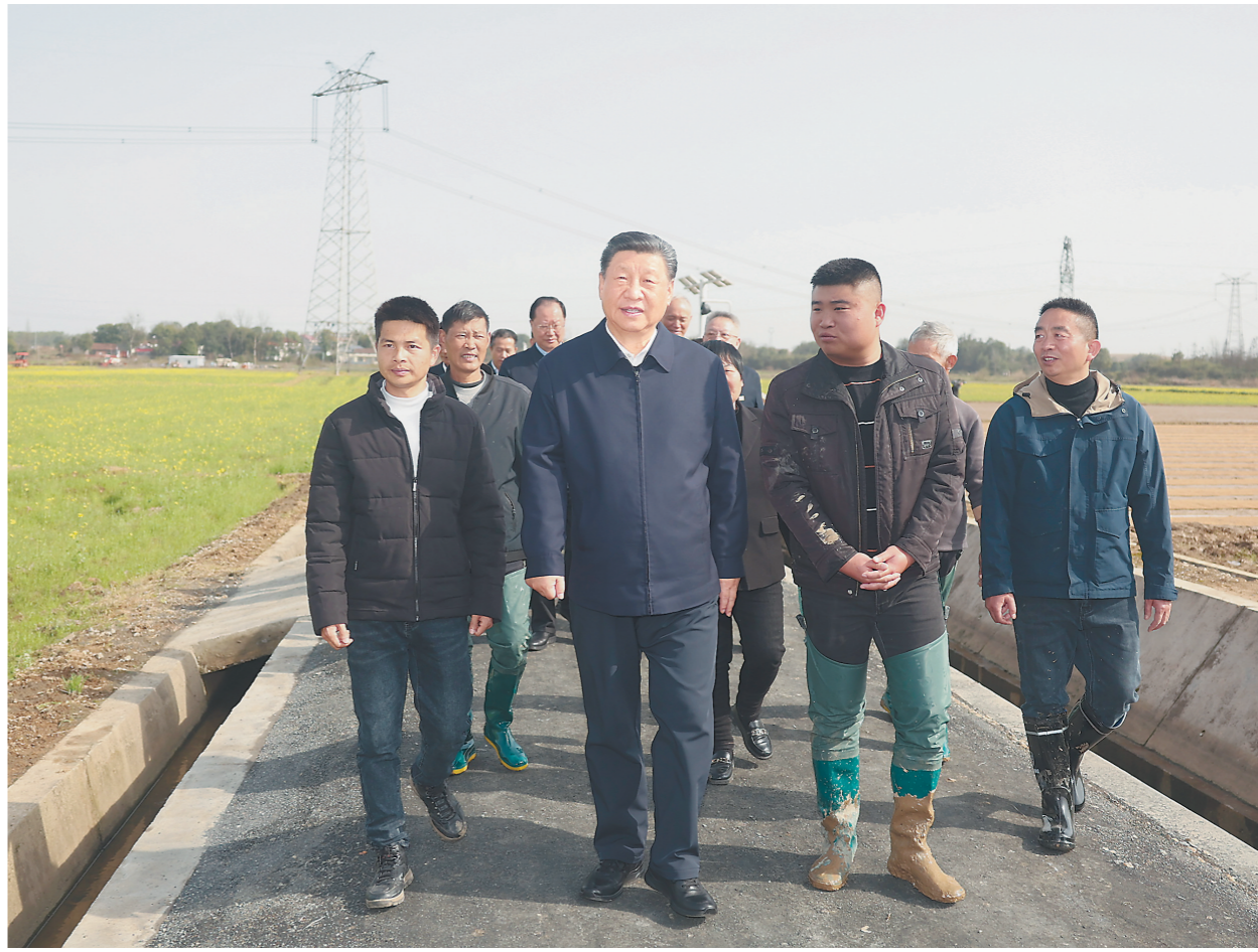
3月18日至21日,中共中央总书记、国家主席、中央军委主席习近平在湖南考察。这是19日下午,习近平在常德市鼎城区谢家铺镇港中坪村,同种粮大户、农技人员、基层干部亲切交流。

新华社长沙3月21日电 中共中央总书记、国家主席、中央军委主席习近平近日在湖南考察时强调,湖南要牢牢把握自身在构建新发展格局中的战略定位,坚持稳中求进工作总基调,坚持高质量发展不动摇,坚持改革创新、求真务实,在打造国家重要先进制造业高地、具有核心竞争力的科技创新高地、内陆地区改革开放高地上持续用力,在推动中部地区崛起和长江经济带发展中奋勇争先,奋力谱写中国式现代化湖南篇章。