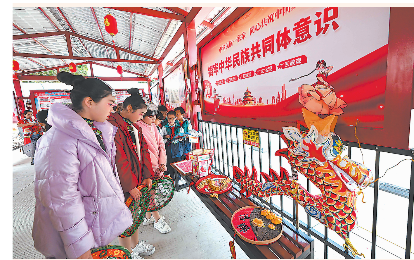
21日,泉州市泉港山区在山腰街道举办铸牢中华民族共同体意识主题月活动,吸引了数百人参与。现场举行了民族宗教政策法规宣传、民族特色手工艺品展览、文艺演出等活动。据悉,泉港区是我国20个民族工作重点县(市、区)之一,现有33个少数民族,6个民族村(社区),少数民族人口约2.27万人。此次活动由泉港区委统战部等部门联合主办。

湖湘大地,红色热土,一大批优秀中国共产党人从这里走向历史的舞台,如群星般光彩夺目。