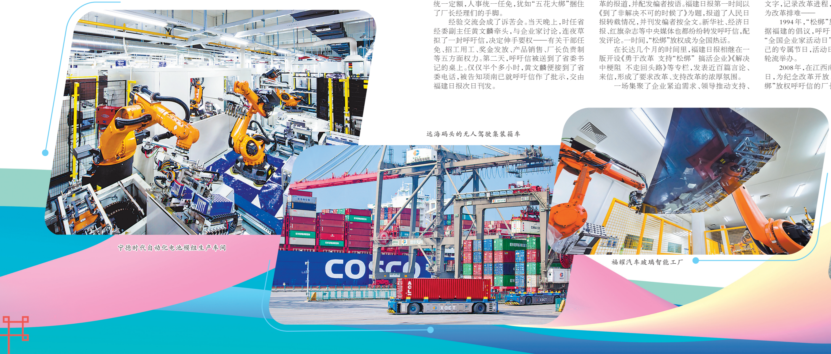
宁德时代自动化锂电池模组生产车间