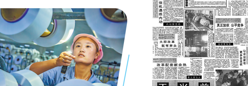
长乐东中集团筒帽生产车间