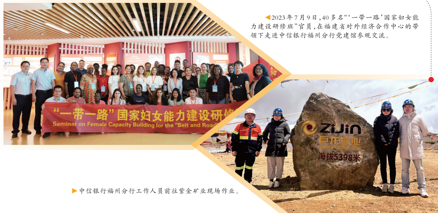
2023年7月9日,40多名“一带一路”国家妇女能力建设研修班“官员”,在福建省对外经济合作中心的带领下走进中信银行福州分行党建馆参观交流。

发挥中信集团“金融+实业”综合经营优势,全方位服务新能源汽车产业链,搭建了涵盖流贷、项目融资、IPO、定向增发、境外债全球协调、供应链金融、融资租赁、股权投资、设备制造在内的产融多维合作体系。成立供应链创新实验室,聚焦新能源行业结算特点,基于产业链龙头企业供应商交易场景及结算周期,定制积分卡审批模式并综合运用线上化多产品服务,简化审批、融资流程,发起设立总规模34亿元的绿色科创基金和规模5亿元的N***基金,主要投向新能源产业链具有科技属性的优质项目。