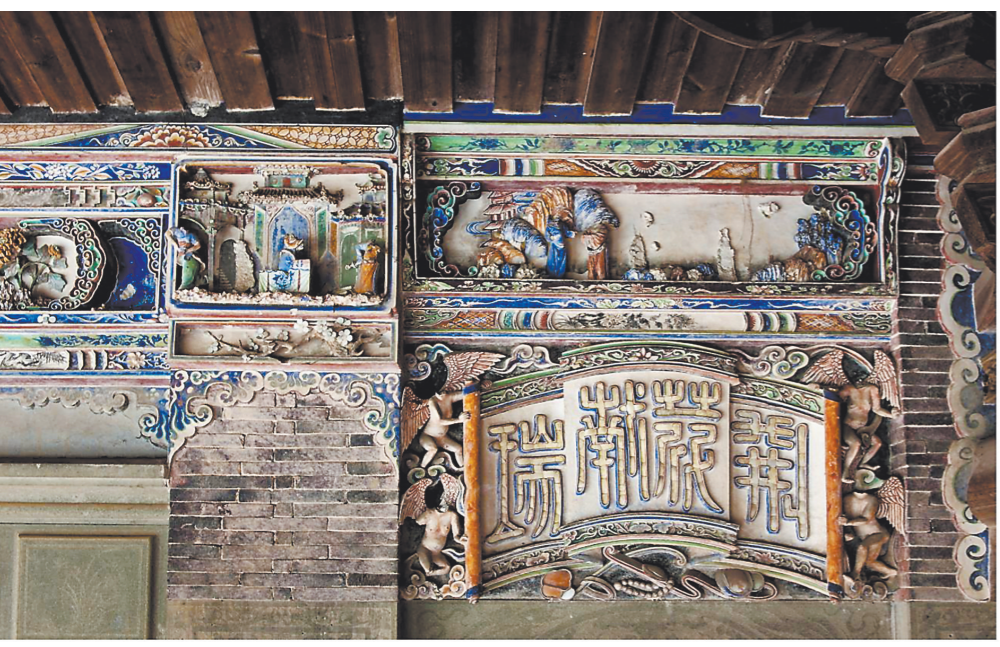
左厢侧门上方灰塑