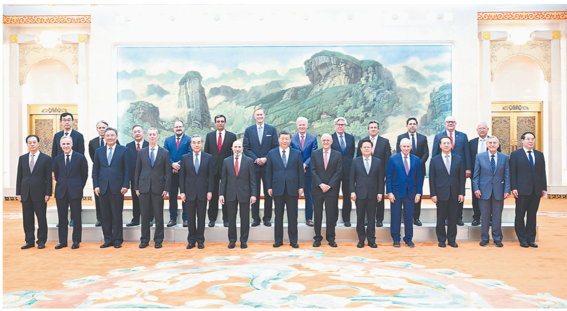
3月27日,国家主席习近平在北京人民大会堂集体会见美国工商界和战略学术界代表。新华社记者 申宏 摄

新华社北京3月27日电 3月27日,国家主席习近平在北京人民大会堂集体会见美国工商界和战略学术界代表。