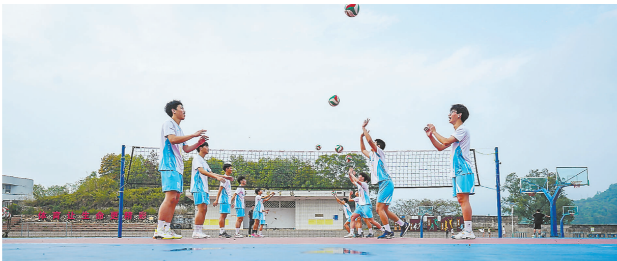
周末体育大课堂 3月31日,泉州南安市金淘镇侨光中学,周末体育大课堂的学生们正在进行排球训练。近年来,作为我省体育特色传统学校的侨光中学,注重培育发展乒乓球、排球等传统体育项目,通过体育运动专业知识讲解与技能普及,丰富学生体育活动。同时,在每周末开设乒乓球、跳绳、篮球、羽毛球等公开运动课程,鼓励学生走进校园进行体育锻炼,促进乡村青少年茁壮成长。

本报讯(记者 肖榕)正衣冠、盥洗礼、献花、鞠躬、敬茶……3月30日下午,在中国工艺美术学会支持下,福建省工艺美术学会举行了以“瓜瓞绵绵 华翰福漆”为主题的中国工艺美术大师袁师永收徒仪式。有关部门和相关行业协会、工艺美术界代表共计100余人参加了这场传统仪式。 袁师永从艺50年,德艺双馨,为福州雕漆技艺重生开拓了一片新的天地,尤其是在创作的题材、画幅和人物的刻画上独树一帜。袁师永潜心研究福州漆艺,师古却不泥古,将多种漆艺技法融会贯通,且自成一格,并先后创作了脱胎漆器《毘卢遮那佛》、雕漆挂屏《朝元图》等代表作品。他表示,希望弟子们能崇尚敬德,守正创新,传承好福州漆艺,让这项具有千年历史的古老技艺在新时代焕发新的光彩。 福州是中国漆艺的重镇,福州漆器是中国漆器的代表之一。作为福州漆艺的代表,拥有200多年历史的脱胎漆器,是“闽都工艺三宝”之一,并与北京景泰蓝、江西景德镇瓷器并称为中国传统工艺“三宝”。2006年,福州脱胎漆器髹饰技艺被列入第一批国家级非物质文化遗产保护名录。福州雕漆也称“福犀”,2022年被列入省第七批省级非物质文化遗产代表性项目名录。