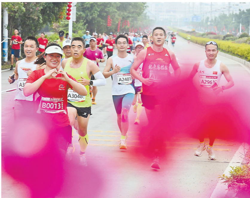
竞跑泉港 3月31日,由省体育局指导,泉港区人民政府、泉州市体育局联合主办的2024“中国长寿之乡·泉港”半程马拉松,在泉州市泉港区锦绣公园鸣笛起跑。来自五湖四海的近万名跑友在春日清晨里共赴山海,用脚步丈量泉港的独特魅力。 本次赛事是泉港区举办的首个中国田径协会C类认证马拉松赛事,分为半程马拉松和5公里欢乐跑,起点和终点均设在锦绣公园。选手们途经姑妈宫、诚峰一级渔港码头、五里海沙、山腰盐场等泉港地标和人文景观,沿途欣赏山海诗境风光。