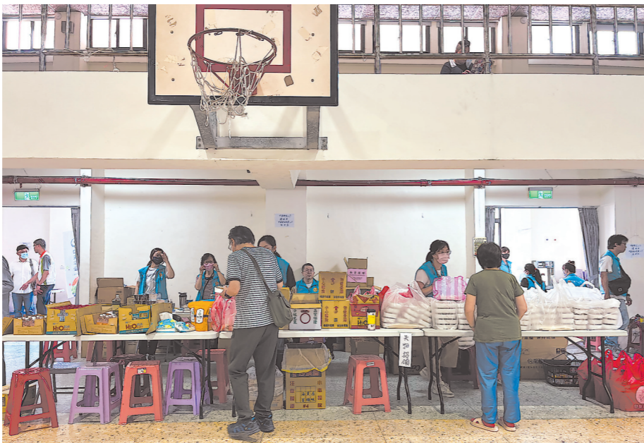
4月4日拍摄的位于花莲中华小学的收容所。

连日来,我们跟踪拍摄严重倾斜的霸王星大楼救援及拆除作业,实地探访花莲市区最大的灾民收容所,挺进太鲁阁公园东西横贯公路入口处报道灾情……见证了