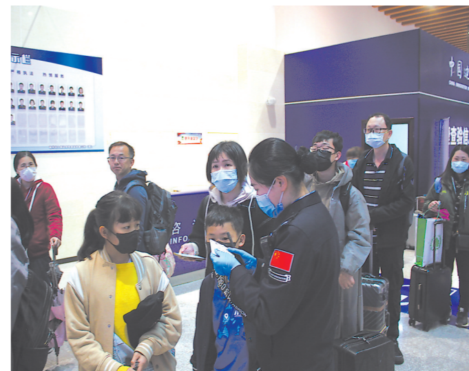
工作人员热情服务台胞旅客。

本报讯(记者 刘深魁 通讯员 吴倩 林春茂)清明节假期,“南北之星2号”轮满载298名旅客驶入琅岐对台客运码头,其中大多数是清明返乡祭祖的台胞。