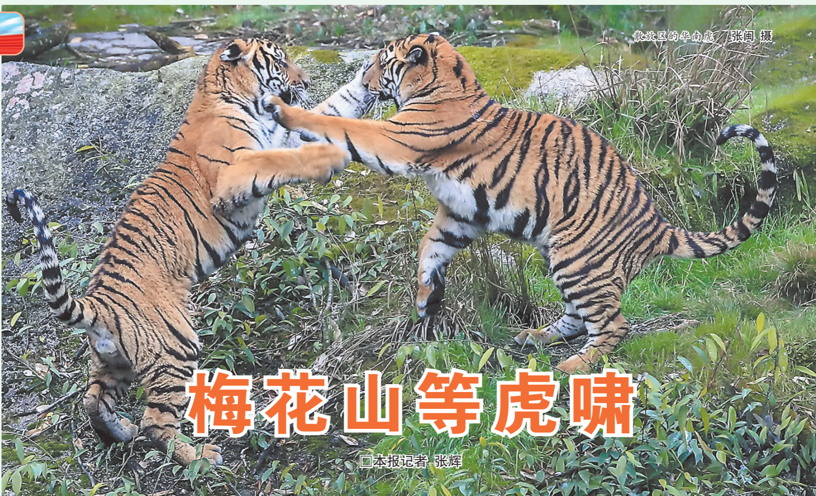
散放区的华南虎

2001年7月,从广西引进的4号母虎分娩产下两雄一雌3只小老虎,实现了华南虎在高海拔地区的首次繁殖。从那以后,梅花山不断“添丁”。每