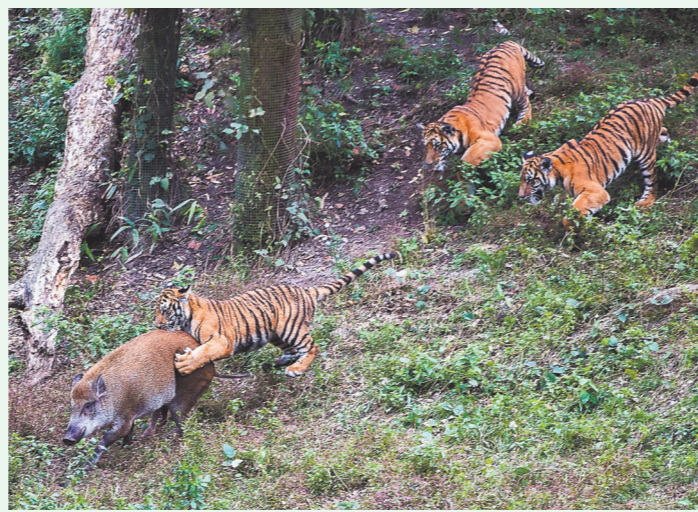
小虎追逐野猪。

在梅花山养虎人的努力下,这些人工圈养的华南虎正逐步恢复野性,慢慢找回食物链顶端物种该有的样子。虎爸虎妈们希望,在未来的某一天,他们的孩子能够回到大自然。那里,才是真正属于它们的家。