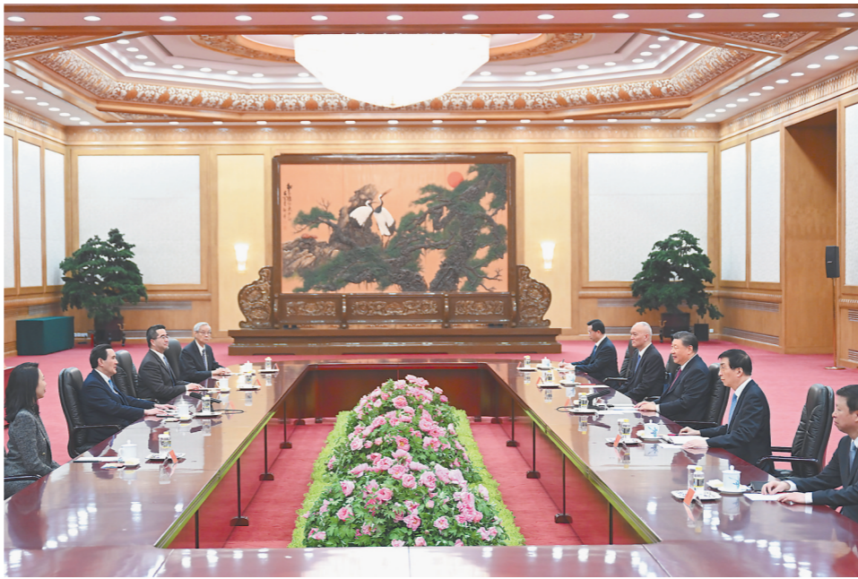
▲4月10日下午,中共中央总书记习近平在北京会见马英九一行。

青年是国家的希望、民族的未来。两岸青年好,两岸未来才会好。两岸青年要增强做中国人的志气、骨气、底气,共创中华民族绵长