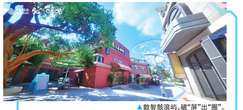
▲数智鼓浪屿,破“屏”出“圈”。