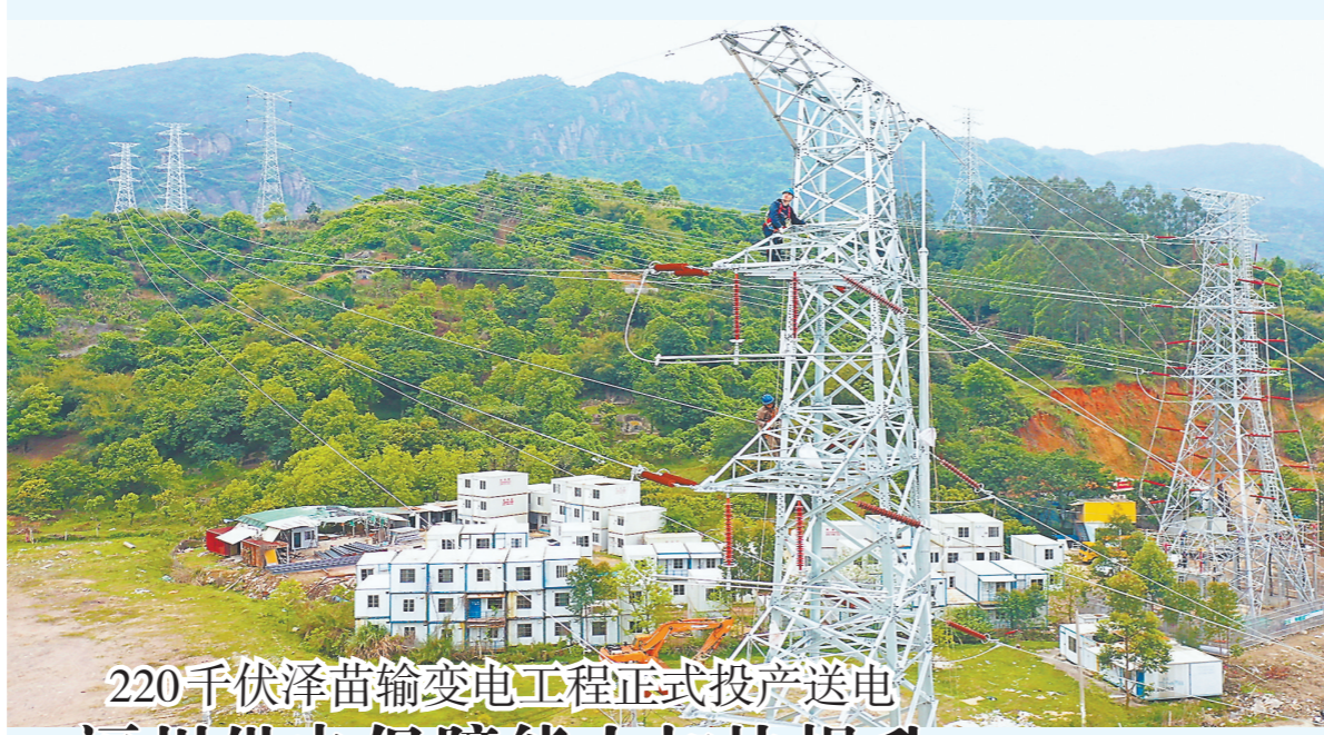
220千伏泽苗输变电工程正式投产送电 福州供电保障能力加快提升

据悉,我国饲料粮消费量占粮食消费总量一半以上。保障饲料粮需求,任务艰巨。2018年以来,农业农村部组织实施饲用豆粕减量替代行动,大力推广低蛋白日粮技术,充分挖掘利用国内饲料资源,着力增加优质饲草供应。2023年,全国肉蛋奶产量比2017年增加了18.1%,豆粕饲用总量下降了6.6%,按照饲料消耗量测算,相当于减少了大豆饲用需求3000多万吨。记者从论坛上获悉,近年来,福建持续做强做优畜禽特色产业。2023年,全省肉蛋奶产量首次突破400万吨,达到406.9万吨,同比增长7.3%;全省饲料产品总产量(含宠物饲料)达1266.5万吨,已连续三年迈入千万吨省份行列。