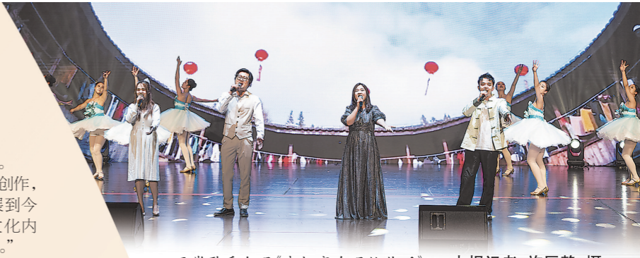
两岸歌手合唱《我把家乡唱给你听》。

这也是本次活动与颁奖盛典的意义。金兆钧希望两岸音乐下一步的创作，可以更大胆地进行创新。“时代发展到今天，我们有条件让具有更独特的文化内涵、特征的音乐，走向全国，走向世界。”