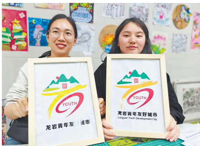
学员上了3次课后的剪纸成果

“这个课程不仅能够体验到一门非遗技艺,一锤一刀的实操还出乎意料地解压,感觉工作的疲劳都消解了不少。”“同学们要注意下刀的角度和力道,宁愿慢一点也不要着急。”26日晚,龙岩市青少年宫内的刻字课堂上,10名学员正拿着刻刀雕刻“五福”。当天是龙岩青年夜校第一期课程的第三次课,4个非遗课堂内座无虚席。