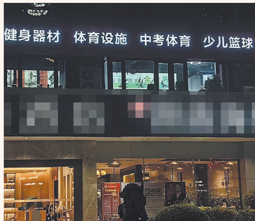
福州有不少中考体育培训机构。