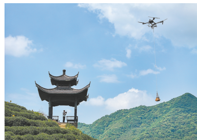
2024年采茶季,在太平猴魁的核心产区——安徽省黄山市黄山区新明乡猴坑村,当地“90后”新农人项凡运用新型运载无人机代替人工帮助茶农在山区间运送农具、茶叶等货物,不仅节约了人力成本,还有效提升了生产效率,助力当地茶产业发展。 图为27日,“90后”新农人项凡操作运载无人机在猴坑村运送货物(无人机照片)。

中央网信办有关负责人表示,违法信息外链问题变异快、跨平台流窜性强,极易反弹反复,各地网信部门要高度重视、周密部署,全面掌握违法信息外链表现形式,集中查处一批问题突出的账号、群组和平台,涉及违法犯罪的,移交有关部门处置,并对外公开曝光,形成震慑效应。通过开展专项行动,建立覆盖各类重点网站平台的跨平台工作机制,及时共享违法外链最新问题表现,扩大联动处置效应,全力铲除违法信息外链滋生土壤。