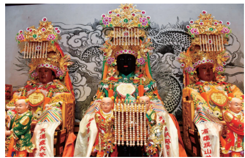
▲神龛内的三尊妈祖像

同安文史专家、原同安县委文化局局长颜立水在《“银同妈祖”祖庙——同安南门天后宫》一文中认