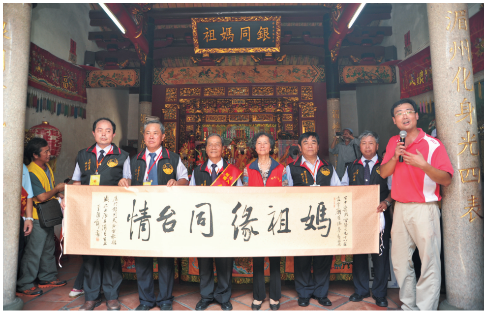
▲2012年,台中乐成宫700余人组团来访银同天后宫。(资料图片)

妈祖文化缘何传至同安?银同妈祖为何黑脸?又是如何传播至台湾?在这背后,蕴含着同安人民瀚海风帆,逐波台湾海峡,经略海洋、走向深蓝的时代壮歌。