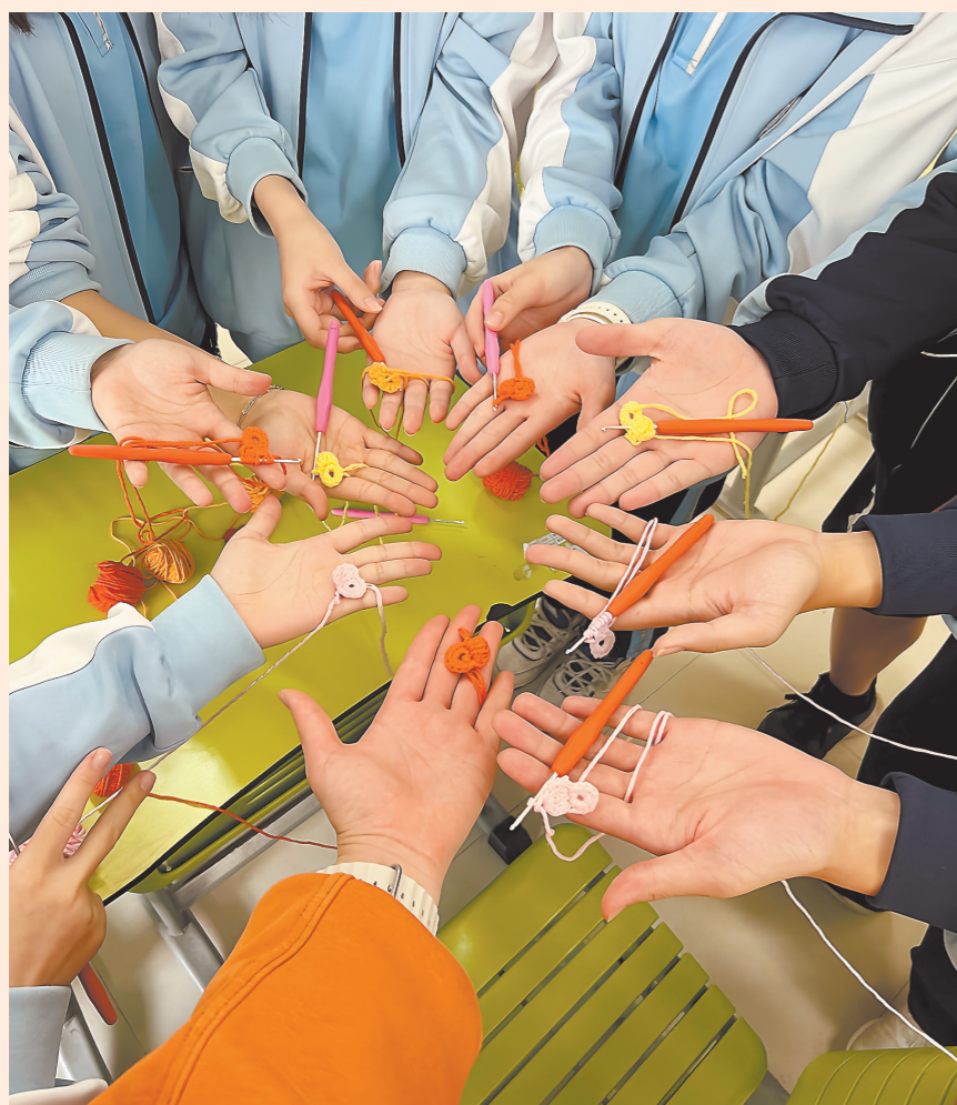
▲钩织活动现场，同学们展示半成品。