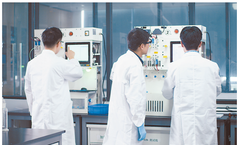
嘉庚创新实验室的科研人员进行实验。