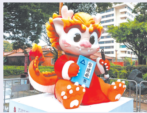
泉州府文庙前广场的龙之八子负负(资料图片)