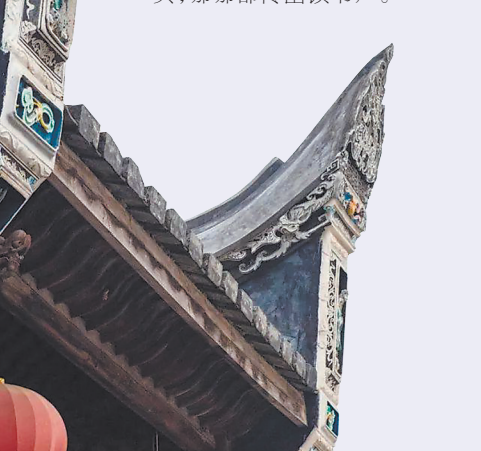
福州城内三坊七巷文儒坊的陈家六子科甲,是清代福建科史上一个奇迹。图为陈承爨故居。

这首南宋著名思想家吕祖谦的诗歌,描述的就是他在福州见到的情形:在路上遇到读书人的概率高达90%;夜晚站在街头,哪哪都传出读书声。