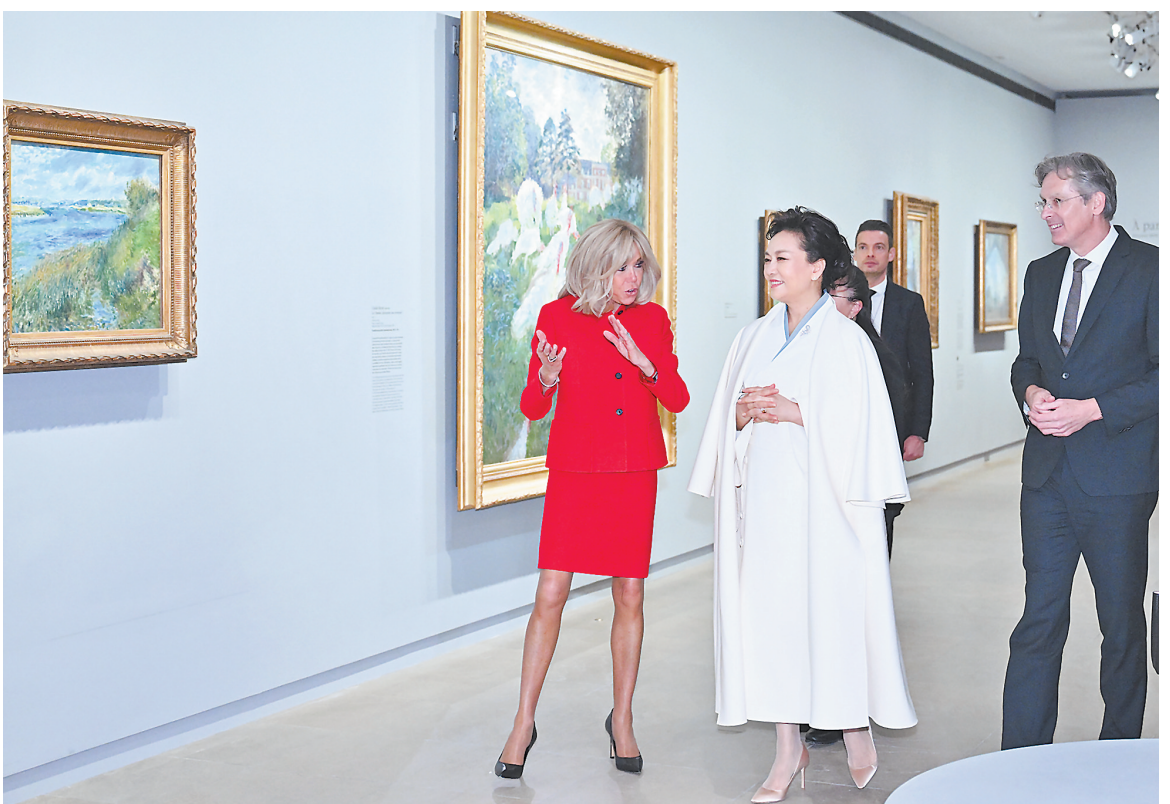
当地时间五月六日下午,国家主席习近平夫人彭丽媛在巴黎应邀同法国总统马克龙夫人布丽吉特共同参观奥赛博物馆。

新华社巴黎5月6日电 当地时间5月6日下午,国家主席习近平夫人彭丽媛在巴黎应邀同法国总统马克龙夫人布丽吉特共同参观奥赛博物馆。布丽吉特在博物馆门口热情迎接彭丽媛。两国元首夫人步入博物馆,观看“巴黎1874,创造印象主义”主题展和博物馆精品油画展。两人不时驻足认真欣赏著名画家莫奈、梵高、雷诺阿等创作的