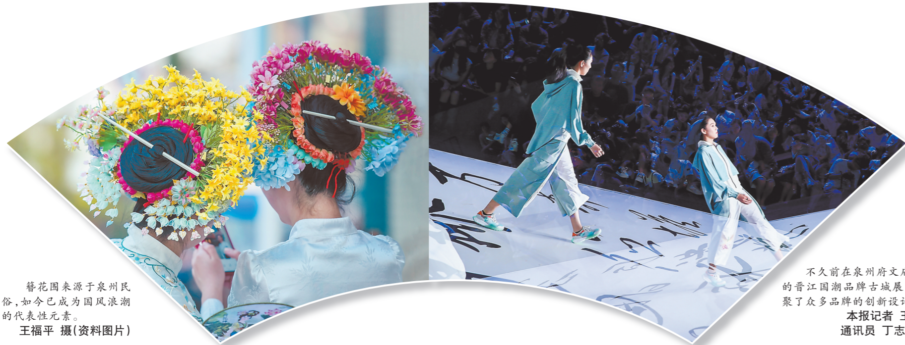
簪花围来源于泉州民俗,如今已成为国风浪潮的代表性元素。 王福平 摄(资料图片)