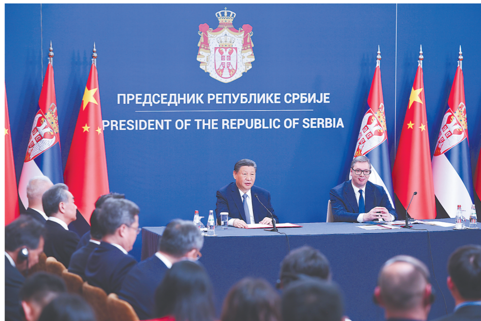
当地时间5月8日中午,国家主席习近平在贝尔格莱德塞尔维亚大厦同塞尔维亚总统武契奇会谈后共同会见记者。

习近平强调,昨天晚上,武契奇总统和夫人以及总理、前总统、议长、外长等亲赴机场迎接我和我的夫人,并安排了别具特色的塞尔维亚演出,令人感动。今天上午,武契奇总统又安排盛大热烈的群众欢迎仪式,我再一次被塞尔维亚人民对中国和中国人民的真挚情感所感动。刚才我同武契奇总统在亲切、友好的气氛中,就中塞关系和双方共同关心的问题深入