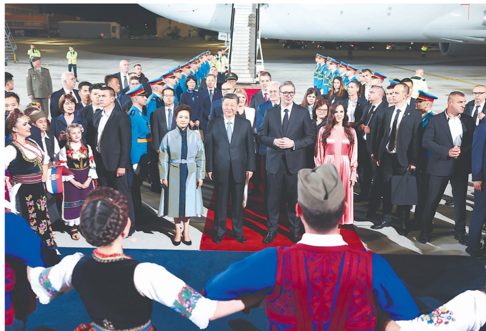
当地时间5月7日晚,国家主席习近平乘专机抵达贝尔格莱德,应塞尔维亚总统武契奇邀请,对塞尔维亚进行国事访问。习近平乘坐专机抵达贝尔格莱德尼古拉·特斯拉国际机场时,塞尔维亚总统武契奇夫妇,对华合作国家委员会主席、前总统尼科利奇夫妇,议长布尔纳比奇,总理武切维奇和外长久里奇等热情迎接。

习近平发表书面讲话。习近平指出,中塞传统友谊深厚,两国关系经受住国际风云变幻的考验,树立起国与国关系的典范。2016年两国建立全面战略伙伴关系以来,双边关系实现跨越式发展,取得历史性成就。两国政治互信坚如磐石,高质量共建“一带一路”成果丰硕,人员往来更加密切,铁杆友谊深入人心。中塞合作建立在平等互利基础上,