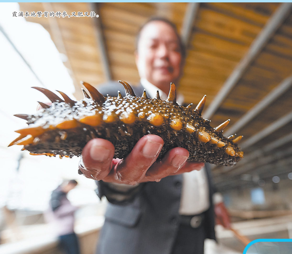
霞浦本地繁育的种参,又肥又壮。