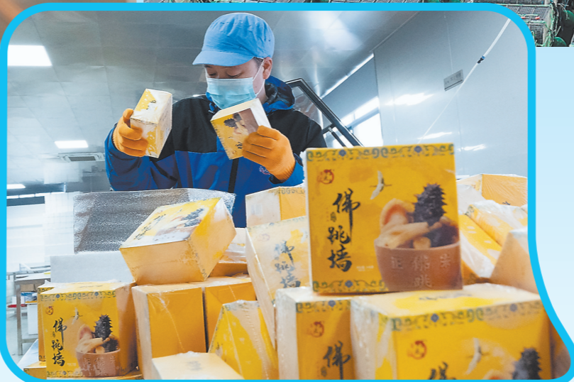
本地海参产业的发展带动了衍生产品的开发。