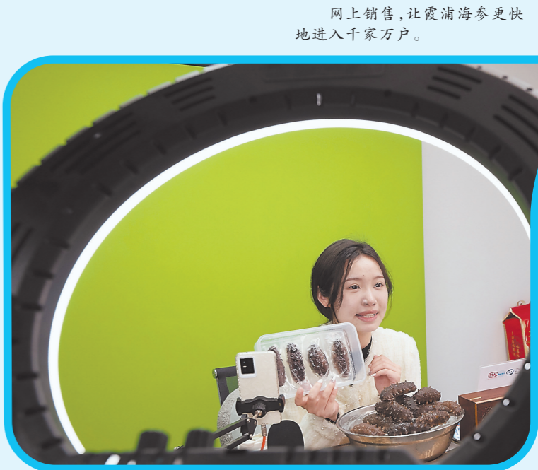
网上销售,让霞浦海参更快地进入千家万户。