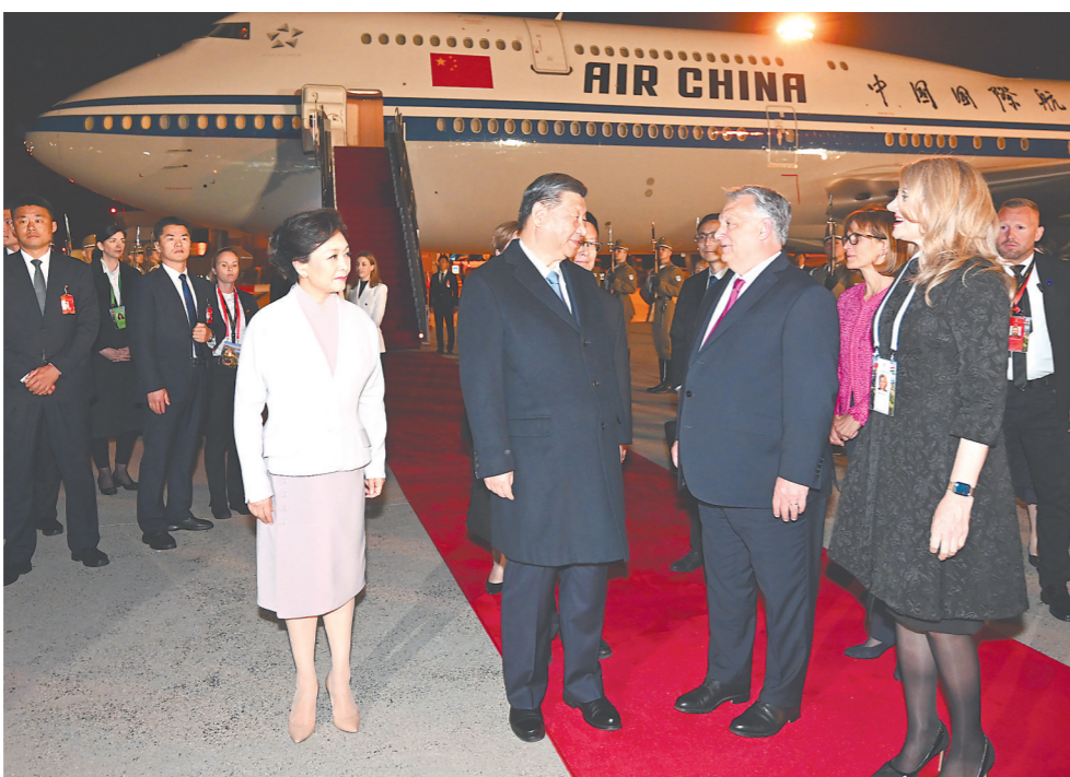
当地时间5月8日晚,国家主席习近平乘专机抵达布达佩斯,应匈牙利总统舒尤克和总理欧尔班邀请,对匈牙利进行国事访问。匈牙利总理欧尔班夫妇、外长西雅尔多等政府高级官员在机场热情迎接习近平和夫人彭丽媛。

习近平乘坐的专机抵达布达佩斯国际机场时,匈牙利总理欧尔班夫妇、外长西雅尔多等政府高级官员热情迎接。两国领导人夫妇亲切握手致意,欧尔班总理向彭丽媛教授献花。礼兵在红毯两侧列队致敬,两名身着民族服装的匈牙利儿童向习近平主席夫妇献上面包和盐,用传统礼节欢迎最尊贵的客人。匈中双语学校的学生向习近平夫妇献花,并用中文说:“欢迎您来到匈牙利”。少年儿童跳起欢快的民族传统舞蹈查尔达什舞,向习近平夫妇致以最热烈的欢迎。