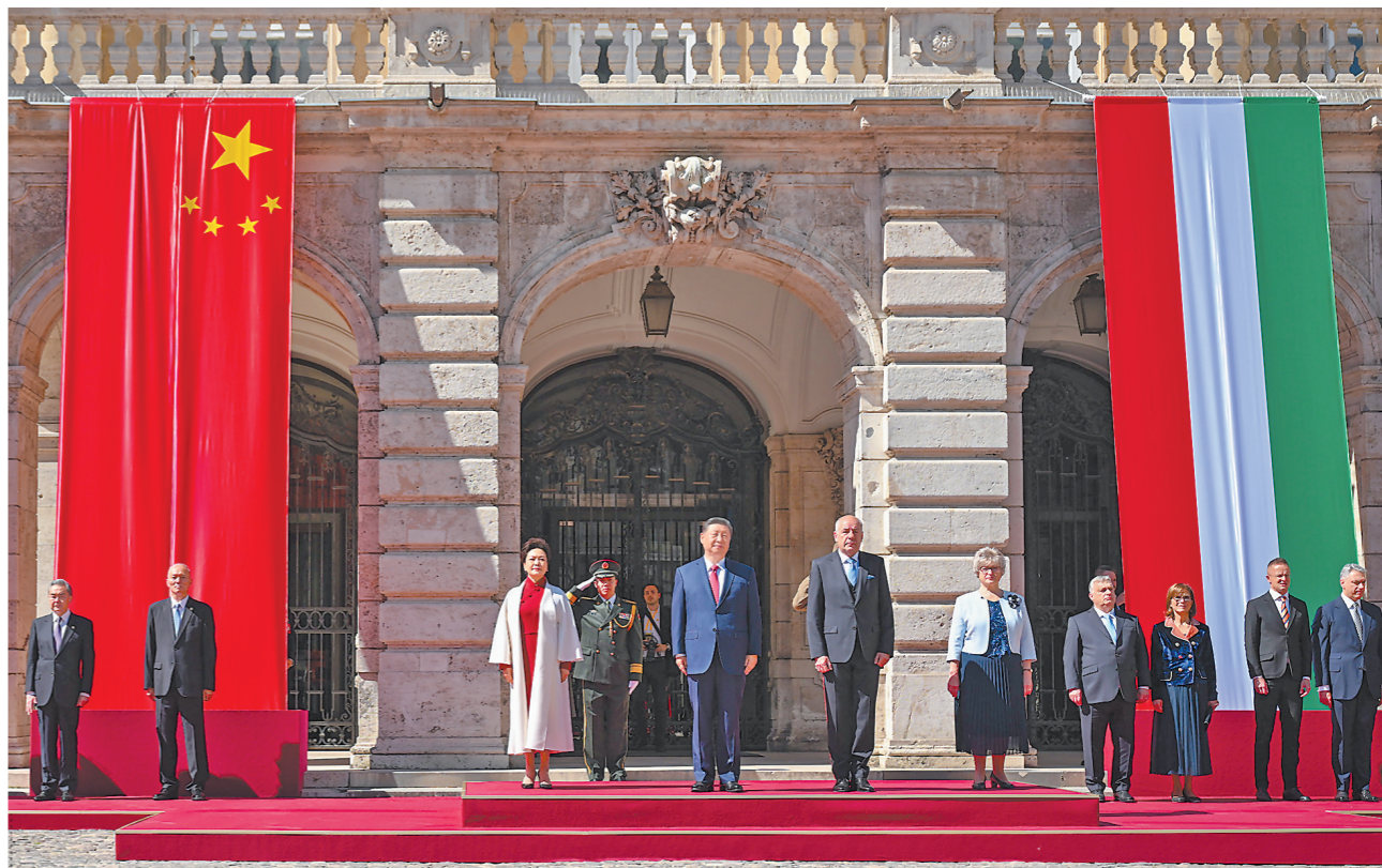
当地时间5月9日上午,国家主席习近平在布达佩斯出席匈牙利总统舒尤克和总理欧尔班共同举行的隆重欢迎仪式。

新华社布达佩斯5月9日电 当地时间5月9日上午,国家主席习近平在布达佩斯出席匈牙利总统舒尤克和总理欧尔班共同举行的隆重欢迎仪式。