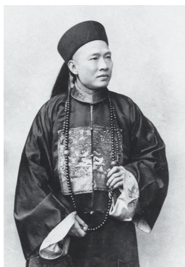
陈季同像 (资料图片)

5月8日,在赴布达佩斯对匈牙利进行国事访问之际,国家主席习近平在《匈牙利民族报》发表题为《携手引领中匈关系驶入“黄金航道”》的署名文章,文章中提到“爱国诗人裴多菲的诗作脍炙人口”。 说起裴多菲,人们大都知道他不朽的名句:“生命诚可贵,爱情价更高,若为自由故,两者皆可抛。”正是这首著名的《自由与爱情》,让这位命运多舛的匈牙利著名诗人走进了中国人的心灵记忆。 资料显示,最先翻译《自由与爱情》的国人是“左联五烈士”之一的殷夫,鲁迅也是较早将裴多菲作品介绍到中国国内的人。 可是,你或许不知道,第一位参与裴多菲诗歌汉语译介的人,是一位福建人。 他,便是被称为“中学西渐第一人”的陈季同。