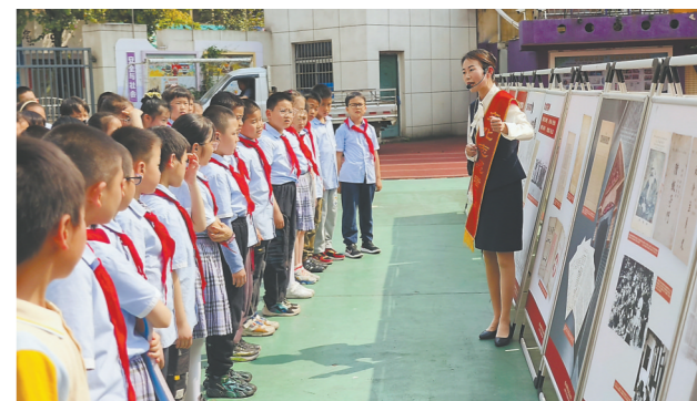
在“5·18世界博物馆日”来临之际,三明市博物馆走进三明学院附属小学,开展“凤展红旗如画”主题图片展和红色故事宣讲活动。讲解员通过革命文物、图片的展示以及互动环节的问答,让孩子近距离感受红色文化的魅力。

据新华社北京5月14日电 中国乒乓球协会14日在官网对中国国家乒乓球队2024年巴黎奥运会女单、男女团体项目参赛运动员名单进行了公示。 女单参赛运动员为孙颖莎、陈梦。女子团体参赛运动员为孙颖莎、陈梦、王曼昱,王艺迪为P卡,即替补队员。男子团体参赛运动员为王楚钦、樊振东、马龙,梁靖崑为P卡。 按照中国乒协《乒乓球项目2024年巴黎奥运会参赛选拔办法(修订版)》相关规定,中国乒协对上述名单进行公示。 此前,中国乒协已对巴黎奥运会混双、男单参赛运动员名单进行过公示。混双参赛运动员为王楚钦/孙颖莎,男单参赛运动员为王楚钦、樊振东。