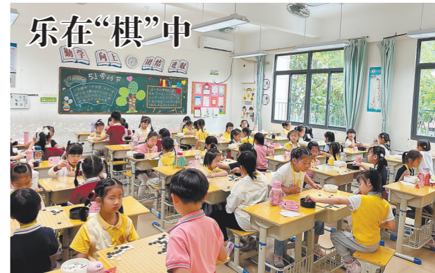
由永春县教育局主办的2024年永春县“刺桐杯”围棋比赛12日圆满落幕,比赛共吸引了来自该县28所学校的320名选手参加。赛事的成功举办,推动了围棋运动在永春的发展,也在当地营造了愈发浓厚的围棋文化氛围,为培养围棋人才发挥了作用。

本报讯(记者 蒋丰蔓)13日上午,福建农林大学戴尔豪西大学联合学院揭牌仪式在福建农林大学举行。 记者了解到,福建农林大学戴尔豪西大学联合学院将于今年9月正式招生。据介绍,福建农林大学与加拿大戴尔豪西大学已有20多年合作办学的经验和成果,在此基础上,中加两所高校成立联合学院,实现合作办学从“项目”到“机构”的更新。 据了解,联合学院将依托福建农林大学学科优势,引进戴尔豪西大学优质教育资源,首批开设农林经济管理、风景园林两个专业,引进微观经济学原理、商务概论、草坪草生产与管理、风景园艺等30余门课程,培养具有扎实学科理论、能将所学方法结合现代信息技术并应用于实际、能胜任各类技术与管理工作的高素质创新型人才。