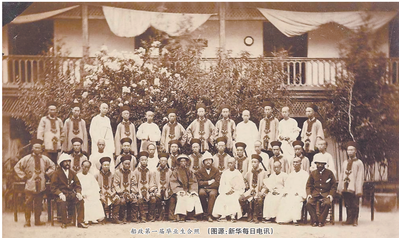
船政第一届毕业生合照