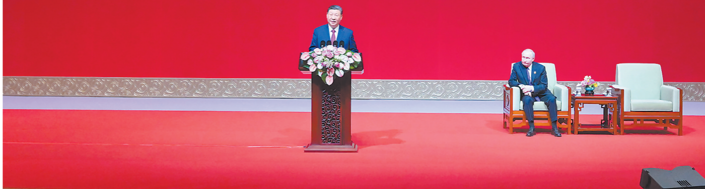
5月16日下午,国家主席习近平和俄罗斯总统普京在北京国家大剧院共同出席“中俄文化年”开幕式暨庆祝中俄建交75周年专场音乐会并致辞。

Торжественная церемония открытия Годов культуры России и Китая - концерт в честь 75-летия новления дипломатических отношений между двумя странами