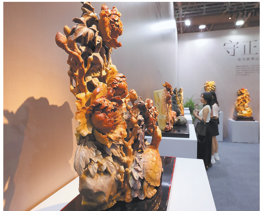
观众在2024中国工艺美术博览会福州工美展区参观。