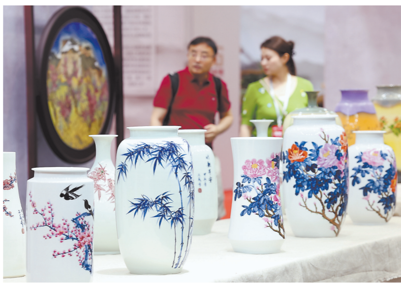
博览会上展出的瓷器,典雅大方。

的大学教室里,首先让学生用泥塑临摹一个作品的基本型。作品达8分以上的学生,就是天赋型选手,再加上后天努力,或许可以成为大师。”