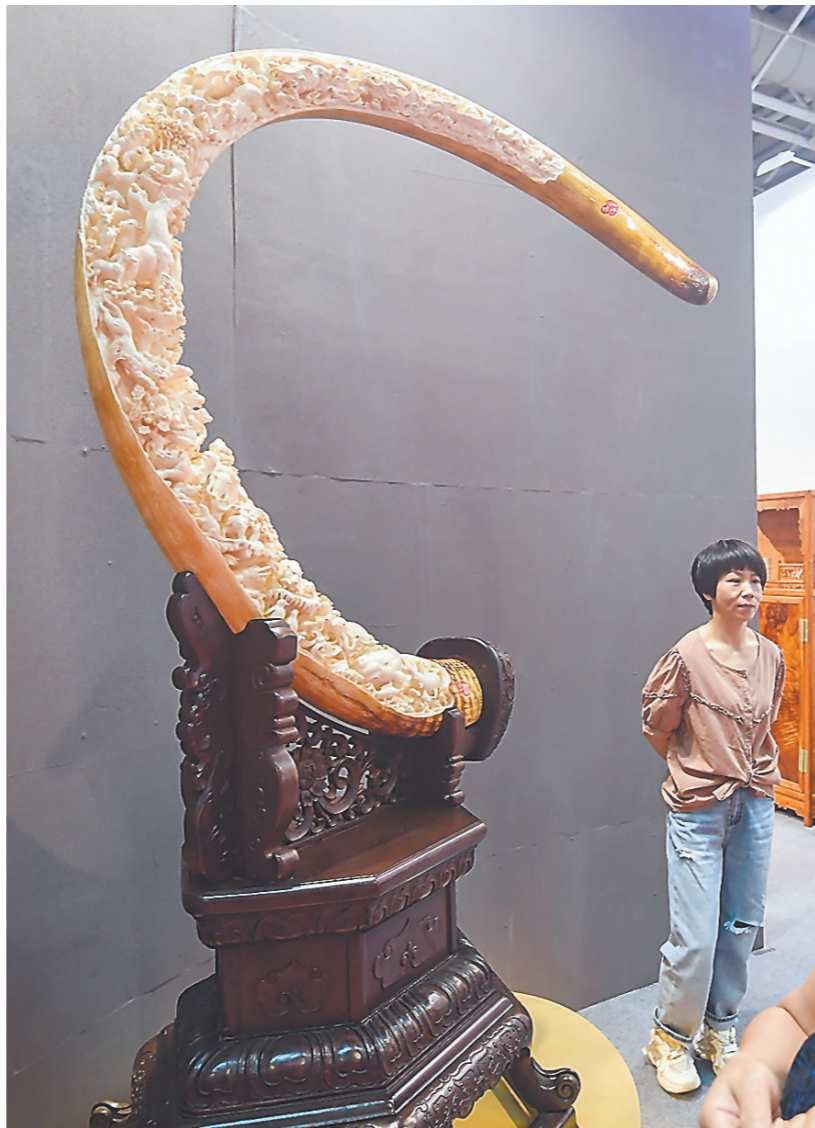
福建馆展出的猛犸象牙雕,巧夺天工。

工艺美术讲究“因材施教”。林建胜曾在泉州工艺美术职业学院任职,后又担任福州大学、福建商学院等客座教师,桃李满天下。“一间坐满50人