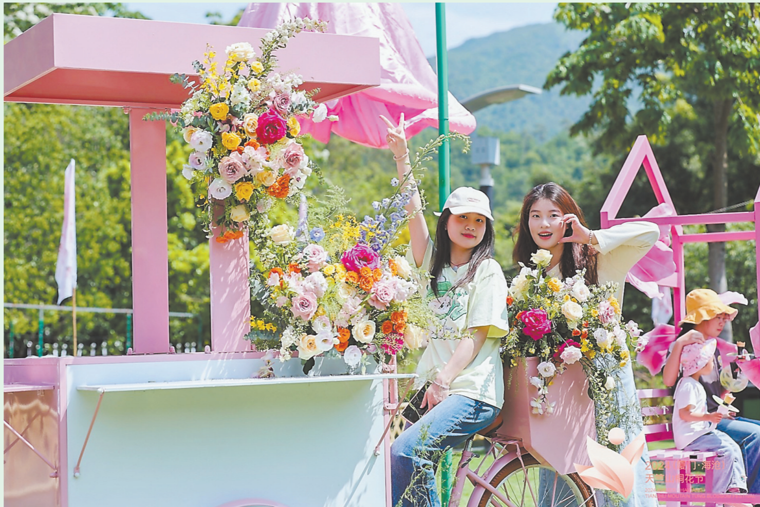
游客在天竺山桐花节上的打卡点留影。

天竺山脚下，原生态乡村洪塘村的红砖古厝、乡间别墅各具特色，咖啡店、农家乐、研学体验等各式业态融入乡野，远处稻田嫩绿，村民翻土、耕地，桃源美景跃然眼前。该村从区域角度与自身特色出发，紧抓“香”这一关键词，打造村庄最具有识别性的三大要素——生态空间的“花香”、生产空间的“稻