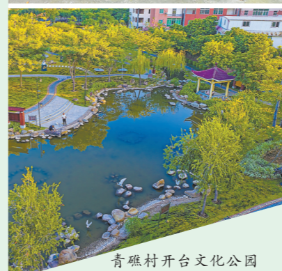
青礁村开台文化公园(资料图片)