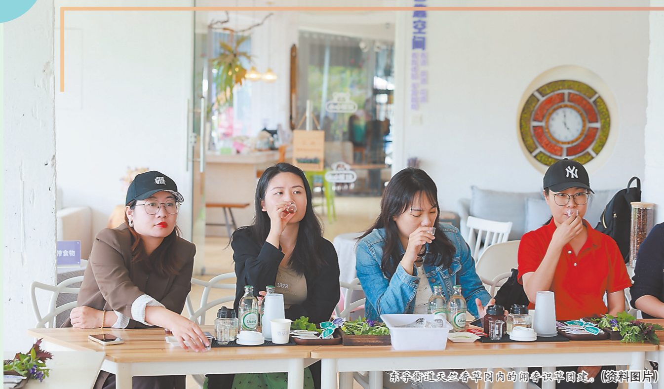
东孚街道天竺山景区内内的闲静咖啡馆。(资料图片)