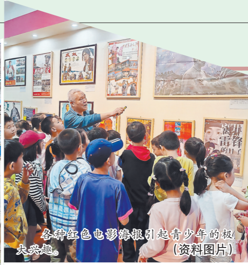
各种红色电影海报引起青少年的极大兴趣。(资料图片)