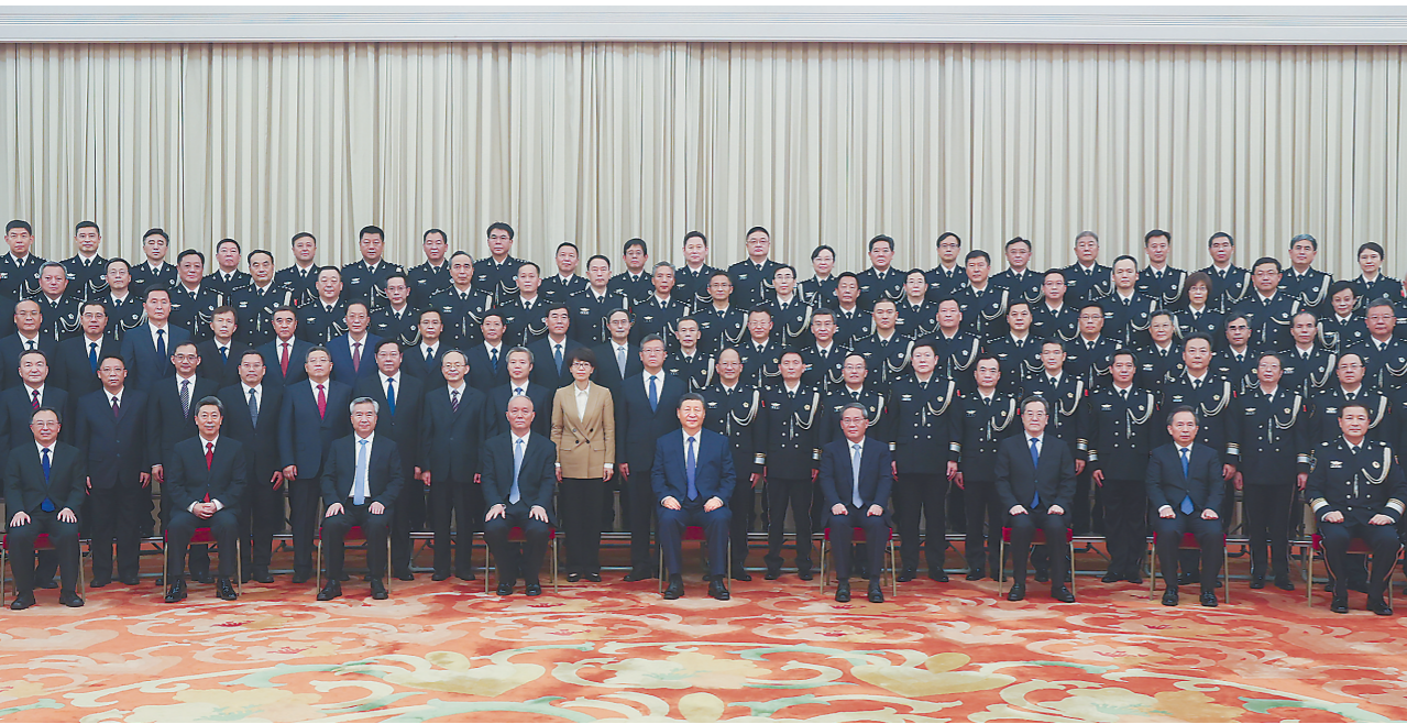
5月28日，党和国家领导人习近平、李强、蔡奇、丁薛祥、李希等在北京人民大会堂会见全国公安工作会议代表。新华社记者 鞠鹏 摄

新华社北京5月29日电 中共中央总书记、国家主席、中央军委主席习近平28日下午在北京人民大会堂亲切会见全国公安工作会议代表，向他们致以诚挚问候，勉励全国广大公安民警辅警奋力推进公安工作现代化，为推进强国建设、民族复兴伟业作出新的更大贡献。 中共中央政治局常委李强、蔡奇、丁薛祥、李希参加会见。 下午4时，习近平等来到人民大会堂西大厅，全场响起热烈掌声。习近平