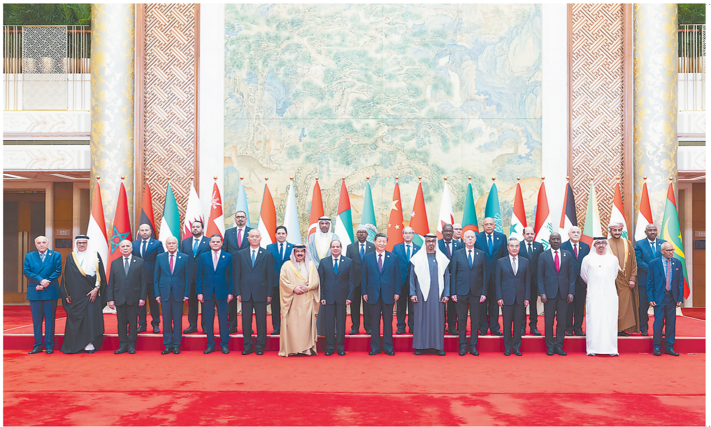
五月三十日上午,国家主席习近平在北京钓鱼台国宾馆出席中阿合作论坛第十届部长级会议开幕式并发表主旨讲话。这是习近平同巴林国王哈马德、埃及总统塞西、突尼斯总统赛义德、阿联酋总统穆罕默德、阿盟秘书长盖特以及二十二位阿拉伯国家代表团团长集体合影。

新华社北京5月30日电 5月30日上午,国家主席习近平在北京钓鱼台国宾馆出席中阿合作论坛第十届部长级会议开幕式并发表主旨讲话。习近平宣布,中方将于2026年在中国举办第二届中阿峰会,中方愿同阿方弘扬中阿友好精神,构建“五大合作格局”,推动中阿命运共同体建设跑出加速度。