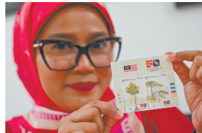
5月31日,在马来西亚吉隆坡,顾客展示购买到的《中马建交五十周年》联合纪念邮票。

证监会表示,依法对恒大地产欺诈发行债券行为按照其所募集资金的20%进行处罚,对其信息披露违法行为处以顶格罚款,为开展债券市场统一执法以来的最严尺度,既依法从重从严惩处财务造假,又充分考虑恒大地产债券规模及保交楼攻坚战等全局性工作,坚持政治效果、社会效果、法律效果相统一。同时,证监会正在推进对相关中介机构的调查。