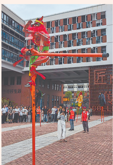
省级非遗项目黄石登瀛高跷

本报讯(通讯员 吴伟锋 文/图) 在2024年文化和自然遗产日来临之际,4日下午,湄洲湾职业技术学院举行非遗进校园活动,邀请非遗传承人走进校园传授非遗技艺,弘扬中华优秀传统文化,提升大学生的民族自豪感和文化认同感,为传承非遗注入青春力量。