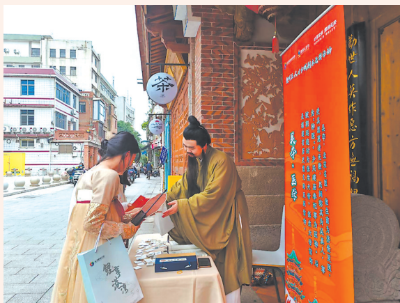
参加“剧本杀”活动的青年协助“剧本杀”配制中药。

“这次活动让我们真实感受到莆阳非遗悠久的历史 and 厚重的文化底蕴。”学生们纷纷表示,通过木雕、泥塑、竹刻、莆仙戏等非遗技艺的精彩展演,大家进一步开阔视野,感受到非遗文化的博大精深。