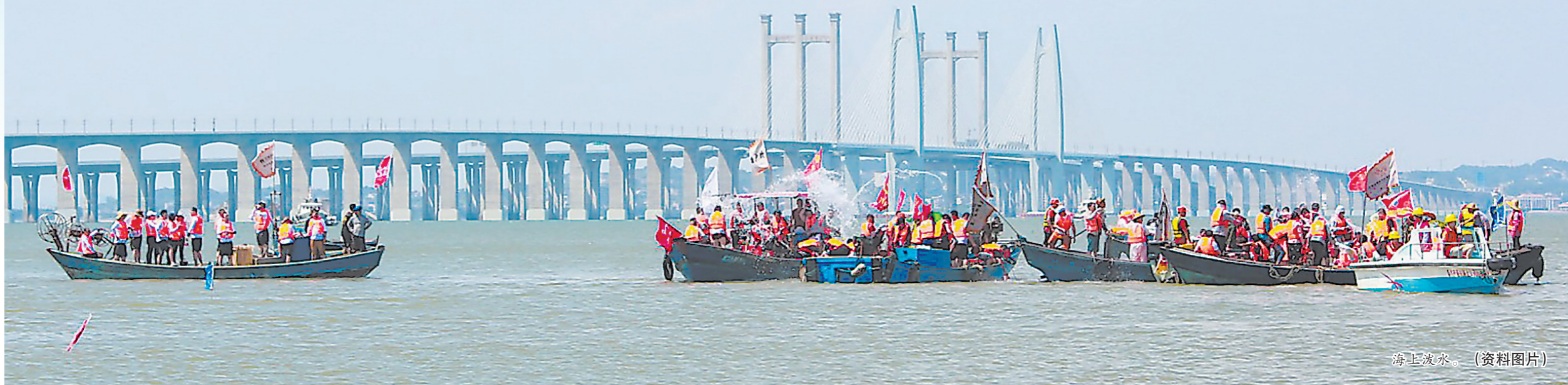
海上泼水。(资料图片)