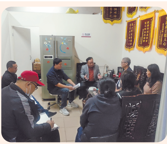
英皇湖畔花园小区物业和业委会开会共商小区发展。