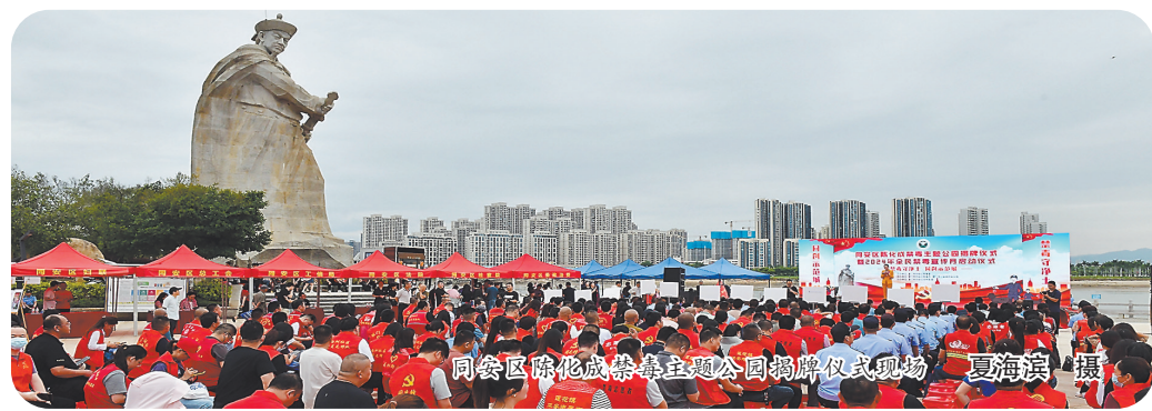
同安区陈化成禁毒主题公园揭牌仪式现场

在提升群众安全感率方面,同安区深化“雪亮工程”建设,健全“三级巡防”“警保联动”和“3、5”分钟快速反应机制,做到警车穿街,警灯常亮。同时,深化道路交通安全综合治理,推进亮灯工程,实现灯亮路畅。积极推行“护校安园”,持续开展平安建设宣传。今年以来,同安区检察院立足检察职能,通过“同心未爱”团队组建一支以16名法治副校长为主的“法治进校园讲师团”,讲师团走进公办学校、民办职校开展平安宣讲,引导未成年人提升法治意识,共建平安、和谐校园。