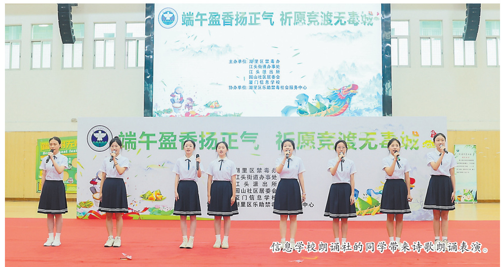
信息学校朗诵社的同学带来诗朗诵表演。

本报讯(记者 廖丽萍 通讯员 陈月萍 文/图) 今年6月26日是第37个国际禁毒日,近日,厦门市湖里区禁毒办、江头街道联合厦门信息学校、江头派出所及湖里区乐助禁毒社会服务中心,共同举办“端午飘香扬正气 祈愿竞渡无毒城”禁毒主题宣传教育活动。