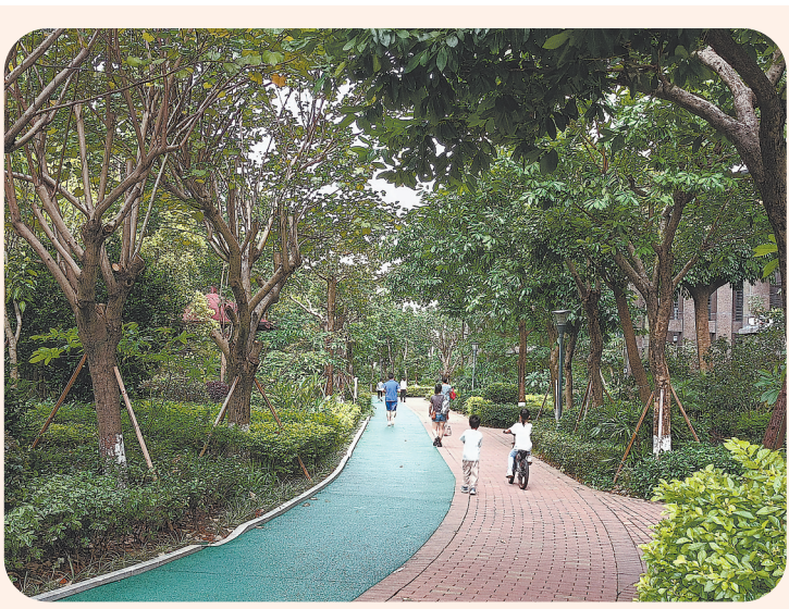
修葺一新的瑞景公园小区健康步道