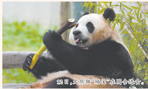
12日,大熊猫“福宝”在圈舍进食。