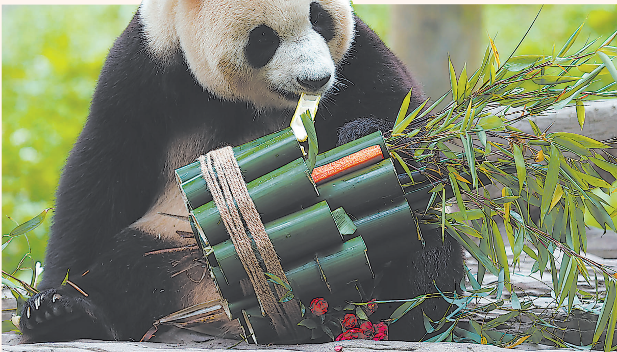
12日,大熊猫“福宝”在圈舍进食。