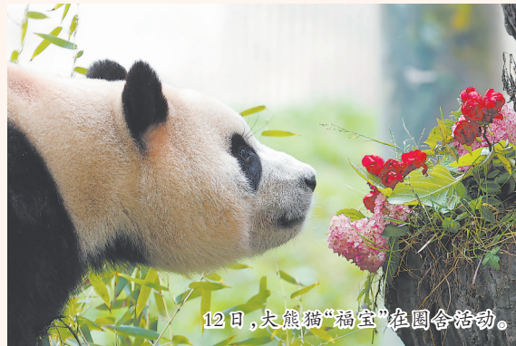
12日,大熊猫“福宝”在圈舍活动。