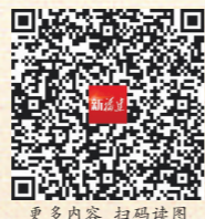
更多内容 扫码读图

今年是中法建交60周年,两国的文化交流活动正在火热进行中。文那用一场持续至明年3月的巴黎个展,让中式美学呈现在大海的辽阔与星空的深邃之中,可谓恰逢其时。