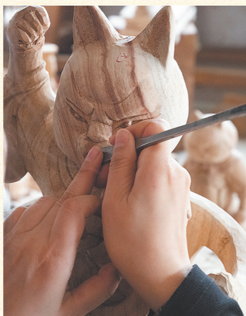
文那仔细修改神仙木雕。