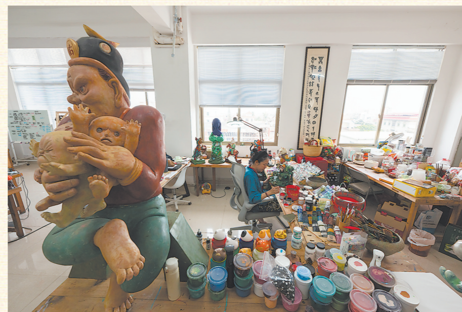
文那的晋江工作室,摆满了大大小小的神像和画笔、颜料。