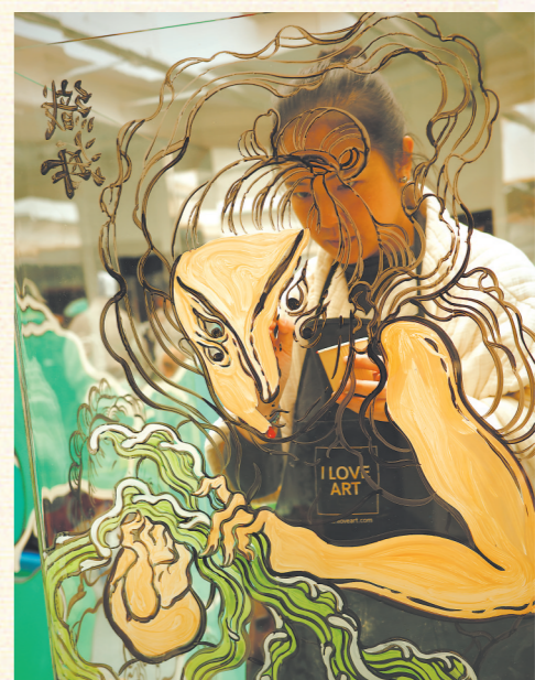
文那在巴黎布展时,现场绘制玻璃壁画。