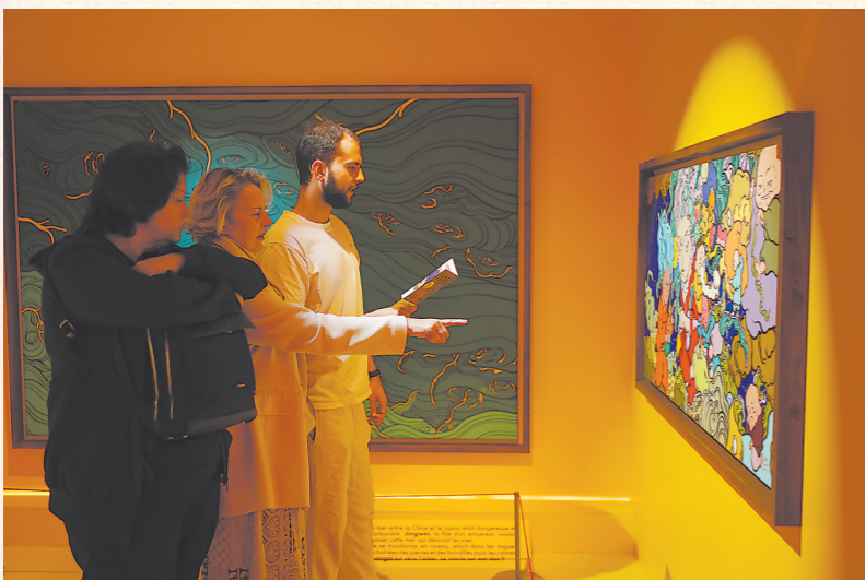
法国观众认真观看中国神话壁画。