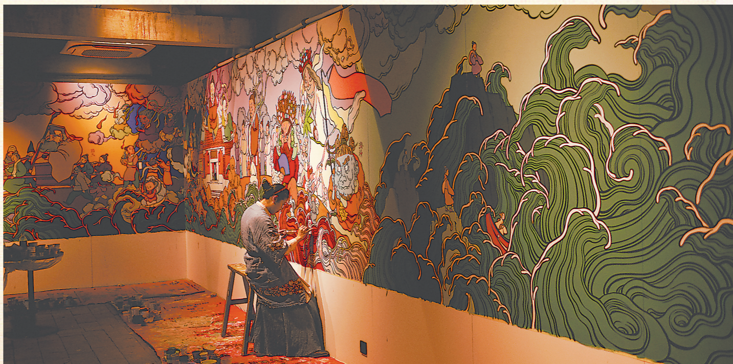
晋江梧林,文那在一间古厝的墙上创作以海上丝绸之路文化为蓝本的闽南创世神话壁画。目前,这幅壁画已经复制到巴黎个展上。