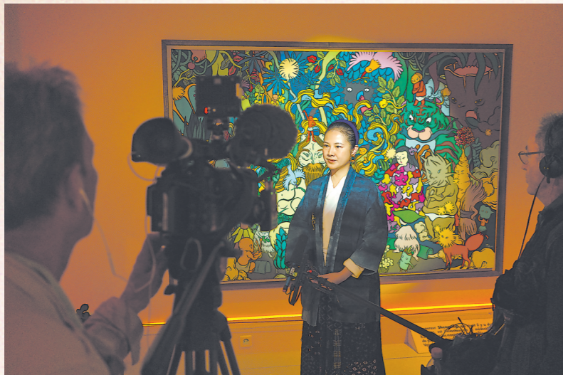
文那在巴黎开展当天接受法国新闻台 FranceInfo 专访。