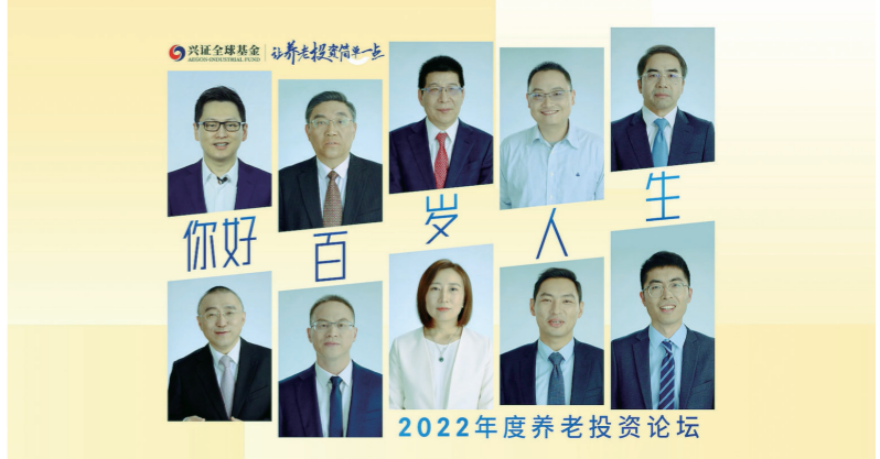
兴业证券子公司兴证全球基金举办《投资·百岁人生》养老论坛，并向投资者发起“百岁人生定投计划”。

以有温度的客户陪伴服务引导形成科学养老理财观念。兴业证券一直高度重视养老投资者的教育工作，早在2022年，子公司兴证全球基金举办《投资·百岁人生》养老论坛，并向投资者发起“百岁人生定投计划”，呼吁投资者以3000万的规划应对长寿时代，活动辐射近3000万受众；2023年，兴证全球基金出版《这样做，迈出养老投资第一步》，这是业内第一本专业投资者给年轻人的养老规划方案指南。该公司也在官网及官方APP设置养老专区，上线了养老计算器、养老小课堂、个人养老金制度解读等一系列使用指南，有效提升客户对养老投资的认知。