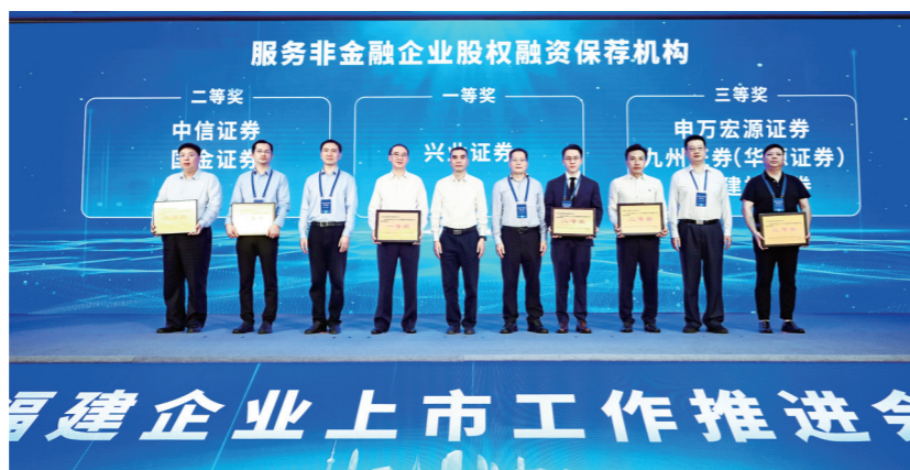
兴业证券荣获福建省金融机构服务非金融企业股权融资一等奖。

服务融资端，助力科创型企业登陆资本市场。兴业证券以服务实体经济高质量发展为初心使命，充分发挥投资银行功能优势，抢抓注册制全面实施的政策机遇，完成省内首单科创板上市、首批新三板精选层、首批北交所上市、首家A拆A上市等多个代表性项目，连续3年获得福建省金融机构服务非金融企业股权融资一等奖，连续6年获评福建省十大金融创新项目。兴业证券投资银行业务总部深耕重点行业，设立了TMT、碳中和、高端制造及新兴产业等行业部，同时发挥集团