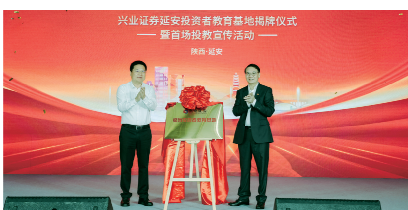
兴业证券延安投资者教育基地揭牌。

服务居民财富稳定增长。兴业证券子公司兴证全球基金自成立以来始终以“基金持有人利益最大化”为首要经营原则，积极发挥普惠功能，截至今年4月底，累计发行公募基金67只，资产管理总规模近6700亿元（含子公司），累计服务客户数近亿人。公司自成立以来（截至今年一季度末），累计为客户盈利达1088.79亿元，单只基金