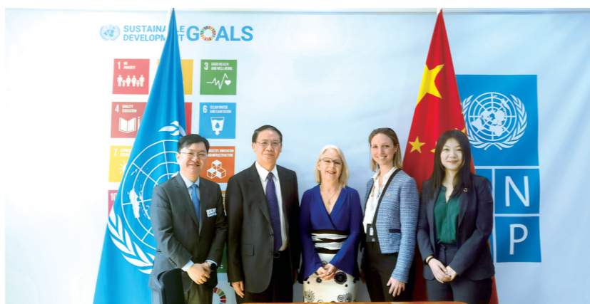
兴业证券与联合国开发计划署在北京举办中国“双碳”投资论坛暨全球可持续发展目标(SDG)投资者地图中国篇二期成果发布会。

兴业证券汇集在碳中和领域的业务经验与专业优势，重点为碳中和上下游产业链企业提供专业投行服务，