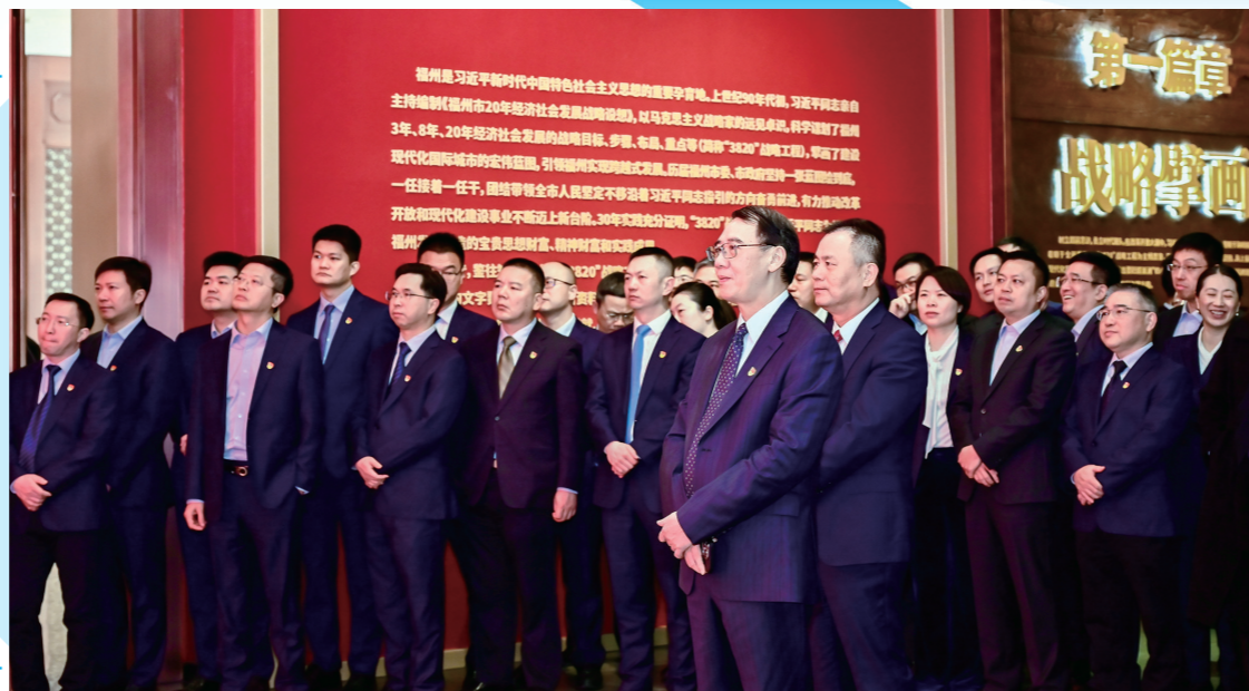
兴业证券党委组织部党员干部参观福州市“3820”战略工程实施30周年成就展。

作为省属国有证券金融机构，兴业证券认真贯彻落实中央和省金融工作会议精神，深刻把握金融工作的政治性和人民性，积极融入和服务国家重大战略，围绕实施新时代民营经济强省战略，发挥证券金融机构创新能力强、投资经验丰富、融资工具多样的优势，不断加大在绿色金融、普惠金融、养老金融等领域的先发布局和创新探索，持续加强对科技创新型企业的服务支持力度，并大力推进自身数智化转型，以高质量发展促进金融强省建设。