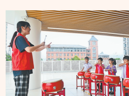
▲孩子们在老师的指导下学习击鼓。 ▼老师带领孩子在自然观察植物。

17日,下午5点放学后,三明市沙县区鼓楼坪幼儿园的一群“萌娃”在老师陪伴下进行丰富多彩的活动,这是该园为留守儿童提供的行为养成教育服务。