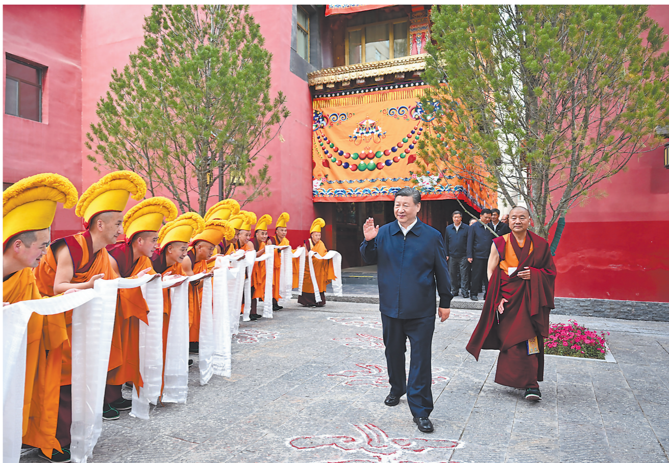
6月18日至19日,中共中央总书记、国家主席、中央军委主席习近平在青海考察。这是18日下午,习近平在位于西宁市中区的宏觉寺考察。

新华社西宁6月20日电 中共中央总书记、国家主席、中央军委主席习近平近日在青海考察时强调,青海要认真贯彻党中央决策部署,完整准确全面贯彻新发展理念,牢牢把握青海在全国发展大局中的战略定位,充分发挥自身优势,坚持深化改革、扩大开放,坚持生态优先、绿色发展,坚持民族团结、共同富裕,在推进青藏高原生态保护和高质量发展上取得更大进展,奋力谱写中国式现代化青海篇章。