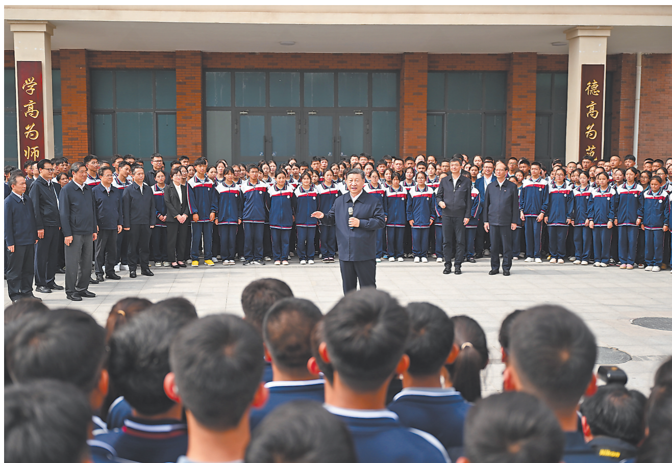
6月18日至19日,中共中央总书记、国家主席、中央军委主席习近平在青海考察。这是18日下午,习近平在果洛西宁市民族中学考察时,同师生们亲切交流。