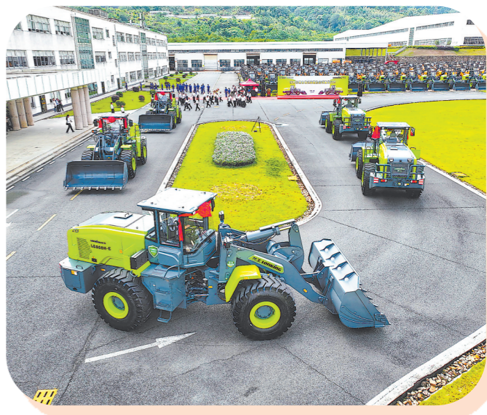
中国龙工携手宁德时代在龙工龙岩基地举行搭载长寿动力电池装载机全球首发仪式。

大爱暖人心,发展为民生。龙岩市不断提高人民生活品质,坚持在发展中保障和改善民生,稳步推进今年30件市委、市政府为民办实事工作,打好“大爱龙岩”品牌。围绕开展“六大专项提升行动”,在抓好就业、托育、养老、住房等民生工作的同时,突出抓好教育、医疗品质提升,落实“教育强市”战略27条措施,实施义务教育薄弱环节改善与能力提升工程项目18个,落实“健康龙岩”战略30条措施,实现国家级临床重点专科“零的突破”。 千帆竞渡,百舸争流,惟奋楫者先、勇进者胜。当历史机缘、时代要求、发展期盼汇聚在一起,龙岩这片红土地上,广大干部群众正以实干争先的姿态,加快建设闽西革命老区高质量发展示范区,奋力谱写新时代新龙岩建设新篇章。今日之龙岩,红土地上芳华绽放,风光无限,未来可期。