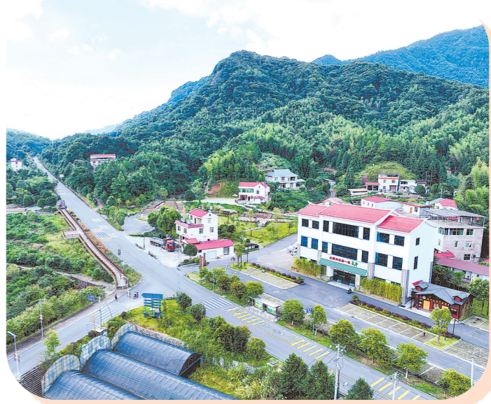
全国林改第一村——武平捷文村