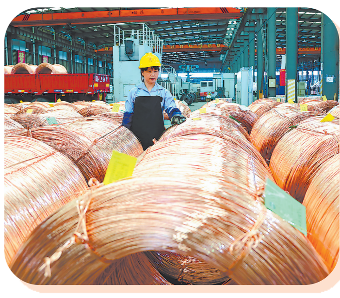
上杭太阳铜业生产车间