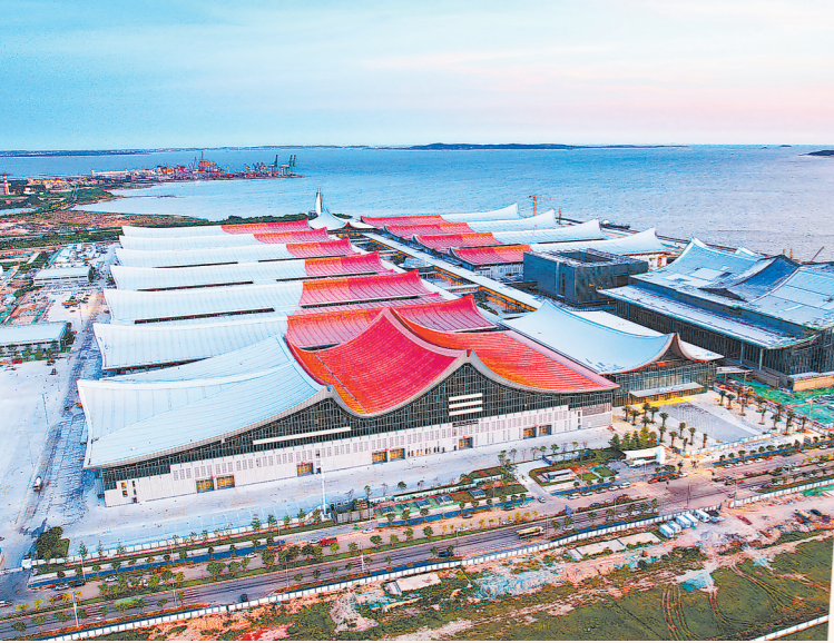
去年12月正式开馆的厦门国际博览中心

厦门市委、市政府正以“为全国探索新路、为厦门赢得先机”的责任担当，全力推动经济社会高质量发展——