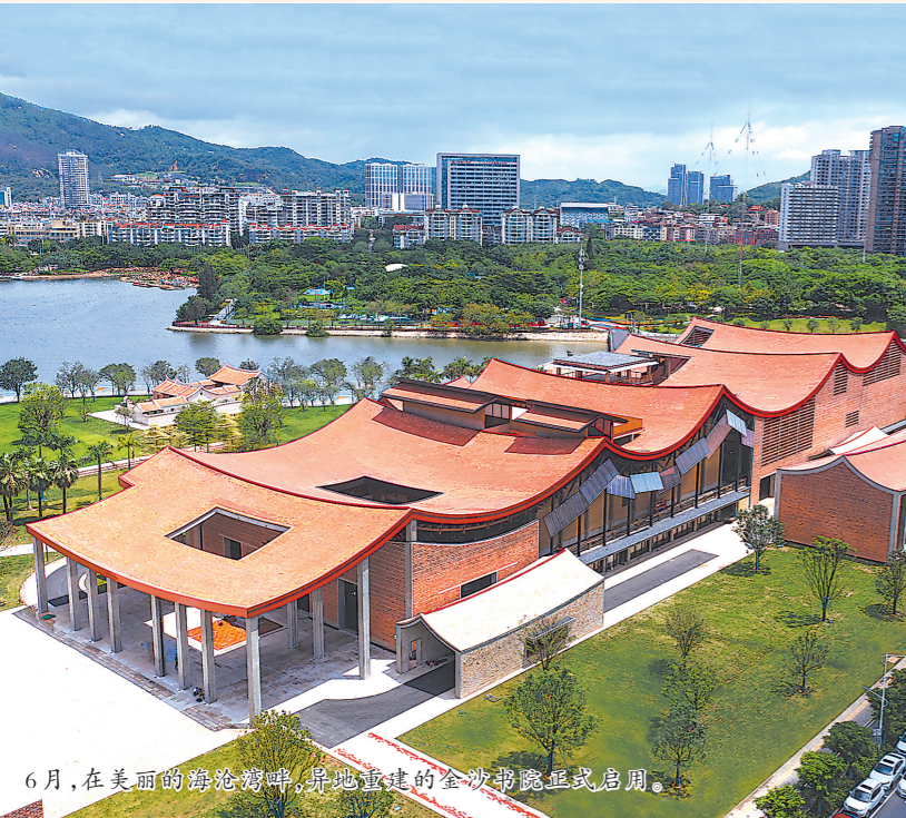
6月,在美丽的海沧湾畔,异地复建的金沙书院正式启用。