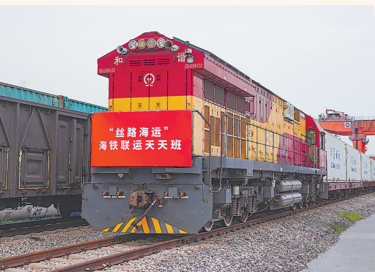
一年多来,赣闽“丝路海运”海铁联运天天班在江西南昌向塘国际陆港和厦门之间往返。