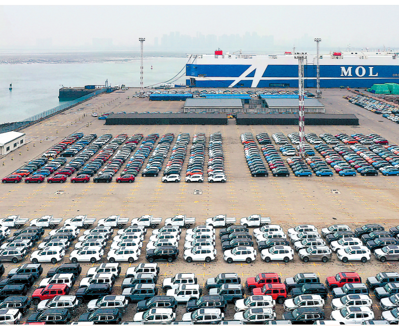
3月,厦门—澳大利亚航线成功首航,国产汽车有了出口新通道。